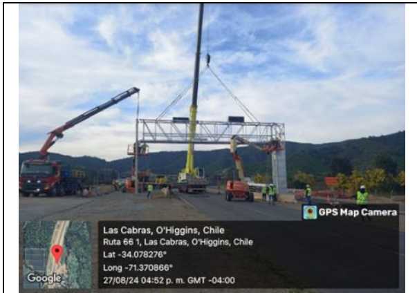
Montaje pórtico peaje freeflow Dm 72.405