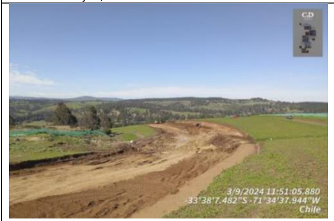
Eje 7, Dm 131.100 B5-3