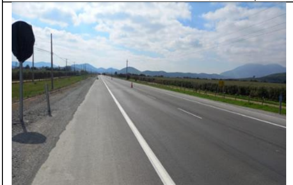
Calzada terminada, Dm 82 aprox.