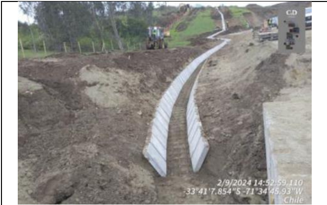
Revestimiento de Canales, Fosos y Contrafosos B5-1