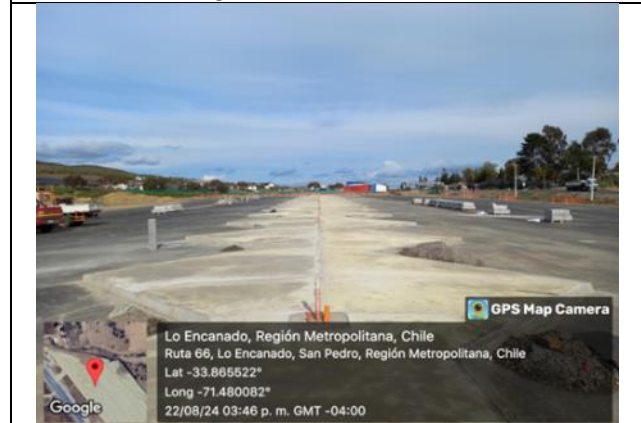
Construcción de aceras estacionamientos en Área de Servicios