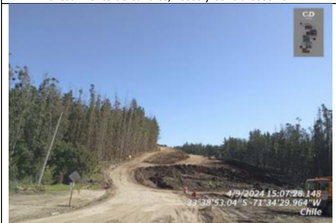
Eje 7, Dm 129.100 - Dm 129.600 B5-2