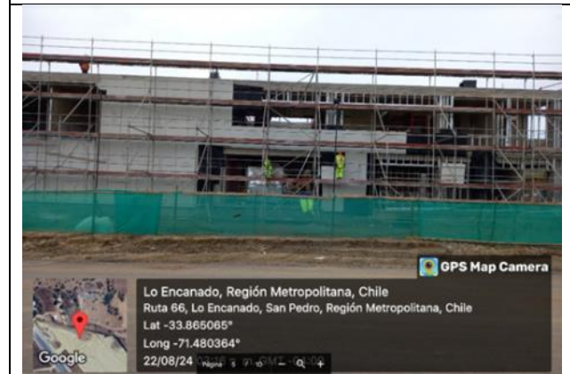
Edificio Administración en Área de Servicios