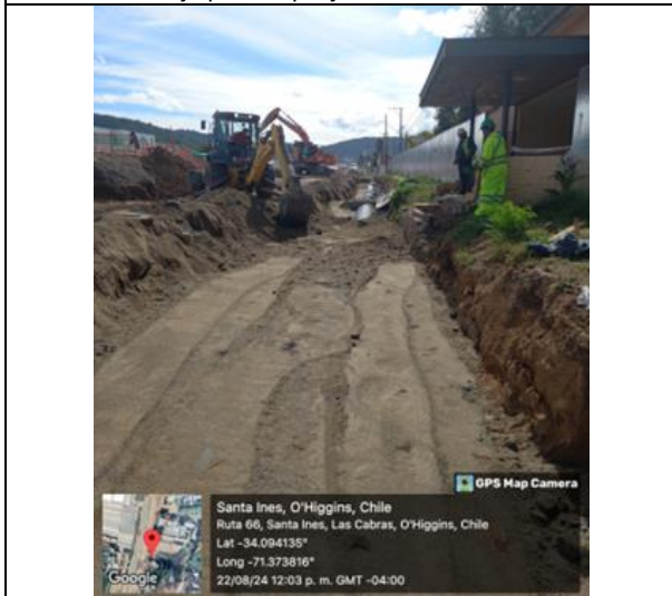
Obras de saneamiento sector Santa Inés, Dm 71 aprox.