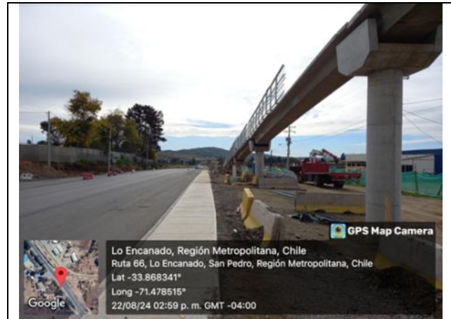
Colocación de vigas Pasarela escuela G-139 Dm 101.186