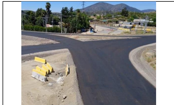
Dm 92.400 Pavimentación Enlace Las Arañas