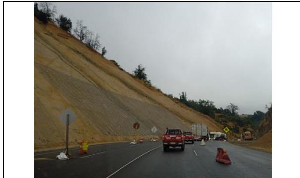
Dm 74.800 Corte Reforzado Cuesta San Vicente