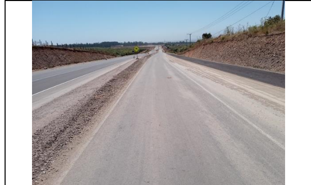
Dm 122.740 Panorámica de la Ruta en corte hacia Acceso a Las Brisas