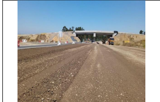
Dm 116.600 Panorámica Paso Inferior Rapel