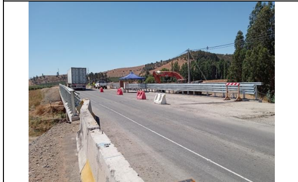
Dm 84.400 Entrada Puente La Cabaña