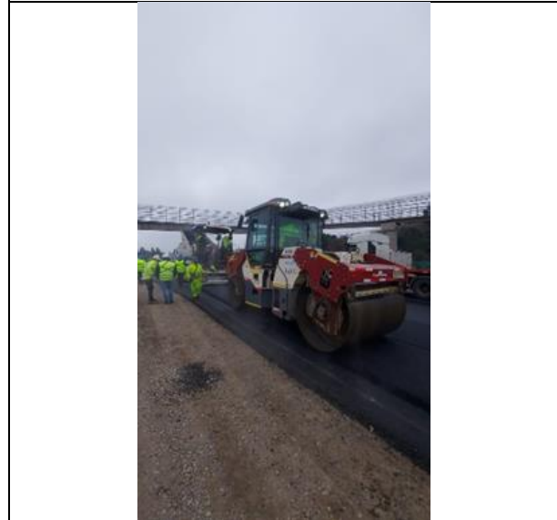
Pavimentación Dm 98.300 aprox.