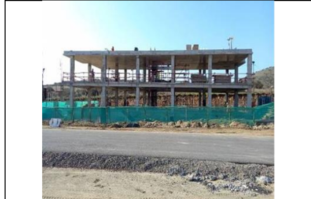
Dm 101.500, Área de Servicios Edificio de Administración