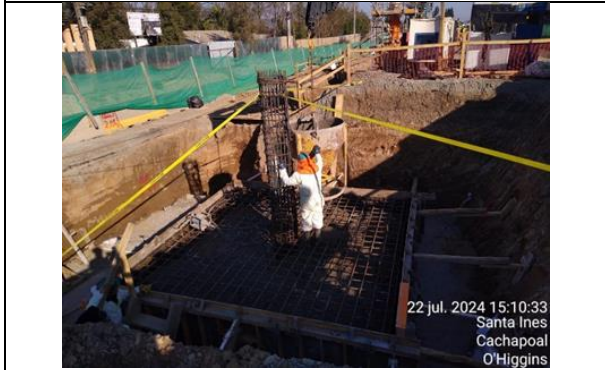
Construcción Pasarela Peatonal sector Santa Inés, Dm 70,7 aprox.