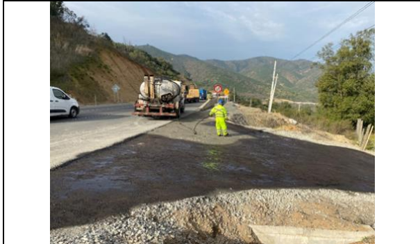
Construcción acceso Dm 74.700 aprox.