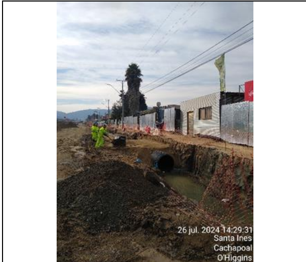
Obras de saneamiento sector Santa Inés, Dm 71 aprox.