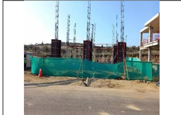
Dm 101.500, Área de Servicios Edificio Inspección Fiscal