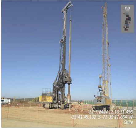
Construcción pilotes Paso Inferior Las Brisas Dm 123.256