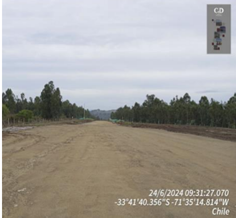
Formación y Conformación de Terraplenes Dm 123.256 a Dm 123.700