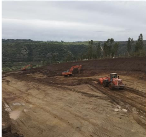
Movimiento de tierras Dm 124.800 a Dm 125.309