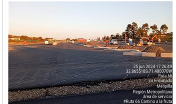
Dm 101.500, Área de Servicios