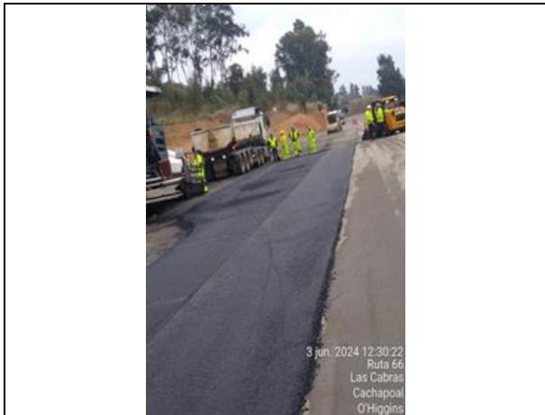
Dm 65.000, Pavimentación calzada