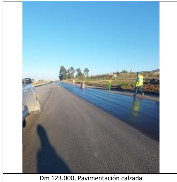
Dm 123.000, Pavimentación calzada