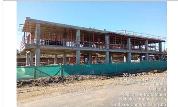
Dm 101.500, Área de Servicios Edificio de Administración