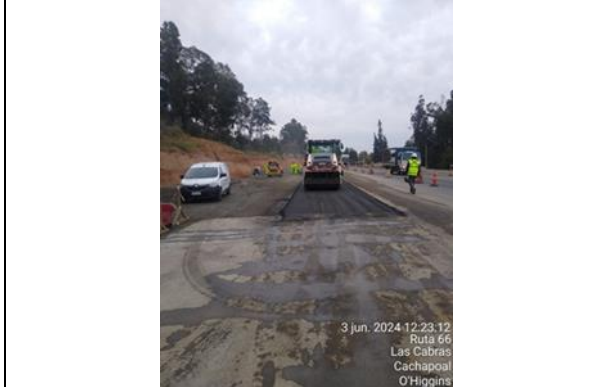
Dm 65.000, Pavimentación calzada