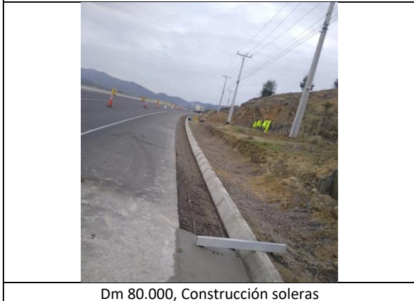
Dm 80.000, Construcción soleras