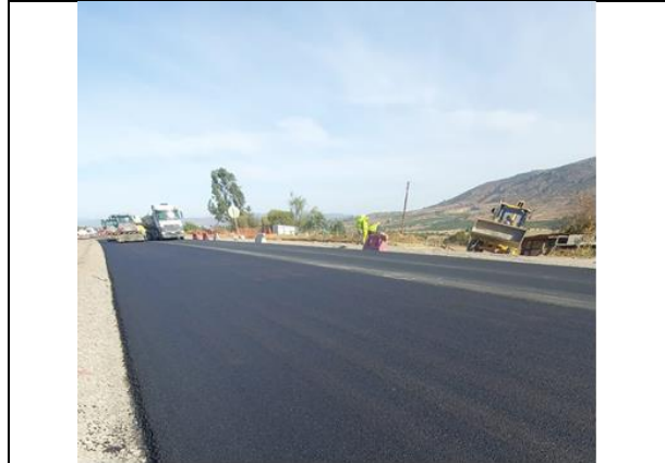
Dm 100.500 al 101.707, trabajos de asfalto