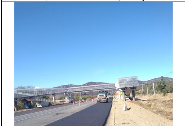
Dm 76.960 a Dm 76.960, Binder en Cruce del Sector Santa Rosa