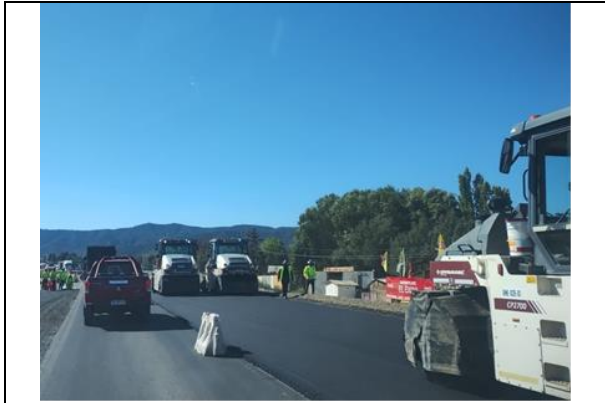
Dm 70.500, Colocación de Binder