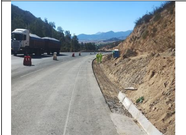
Dm 74.900, Confección de cunetas por la faja derecha