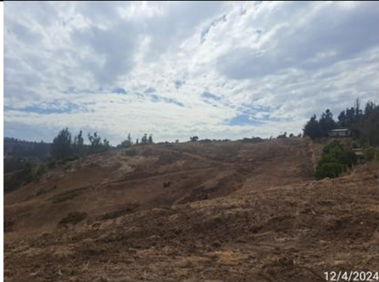
Despeje de Faja en sector del Paso Superior Enlace San Juan