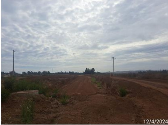
Enlace Las Brisas, escarpe y corte en TCN