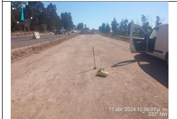
Dm 117.420 a Dm 117.660, preparación de subrasante