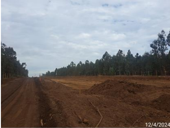
Eje 7, excavación de corte en TCN y confección de terraplén en sectores que requieren rellenos