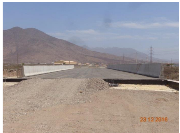
Imagen N°06. Vista Puente El Peñón Sur