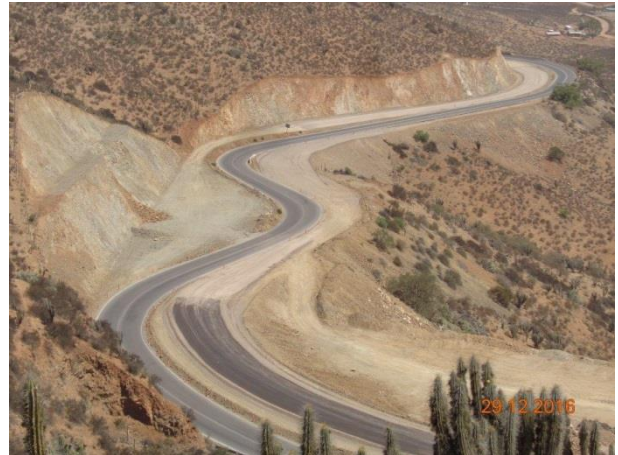
Imagen N°02. Trabajos Cuesta Las Cardas