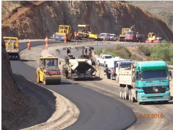
Imagen N°01. Trabajos Cuesta Las Cardas