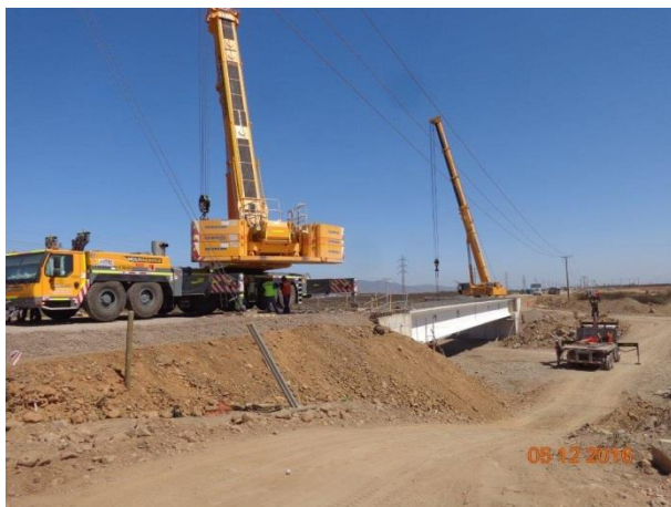
Imagen N°05. Vigas Puente El Peñón Norte