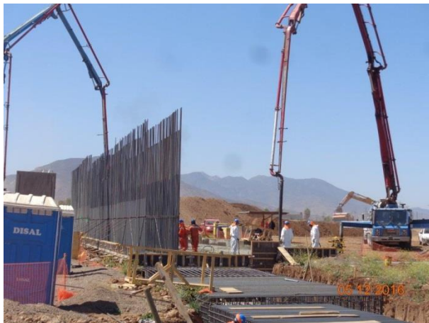
Imagen N°03 Trabajos Paso Superior FFCC