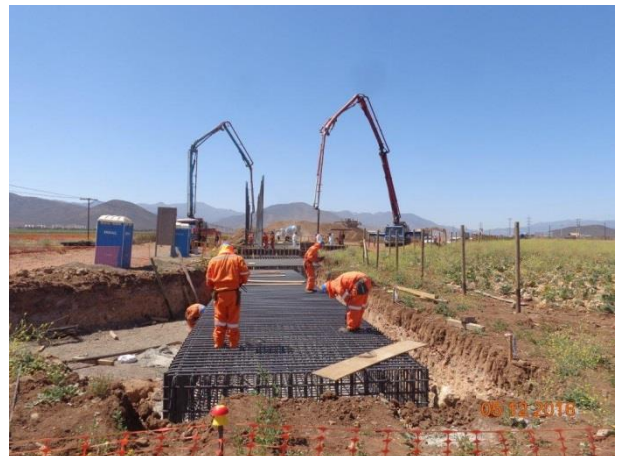
Imagen N°04 Trabajos Paso Superior FFCC