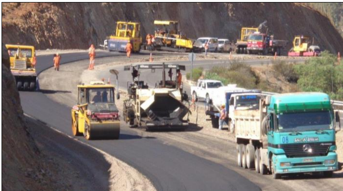
Trabajos Asfalto Dm 40.000

Tramo 4: Avenida Las Torres se ejecutará calzada simple entre Av. La Cantero y Av. Balmaceda.