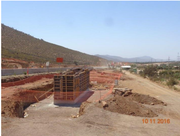
Imagen N°01. Trabajos Pasarela Las Cardas