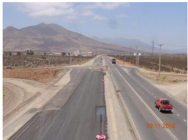
Imagen N°06. Vista Sur Enlace El Peñón