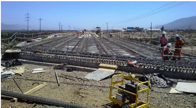
Trabajos Losa Puentes El Peñón Sur

Tramo 4: Avenida Las Torres se ejecutará calzada simple entre Av. La Cantero y Av. Balmaceda.