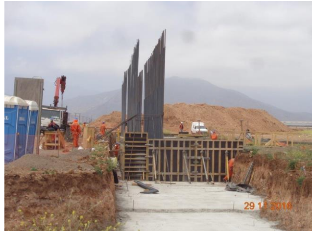
Imagen N°02. Trabajos Paso Superior FFCC