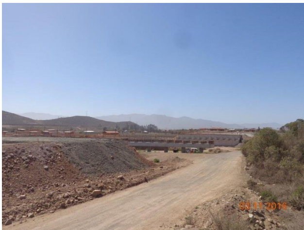
Imagen N°03 Trabajos Puente La Vega