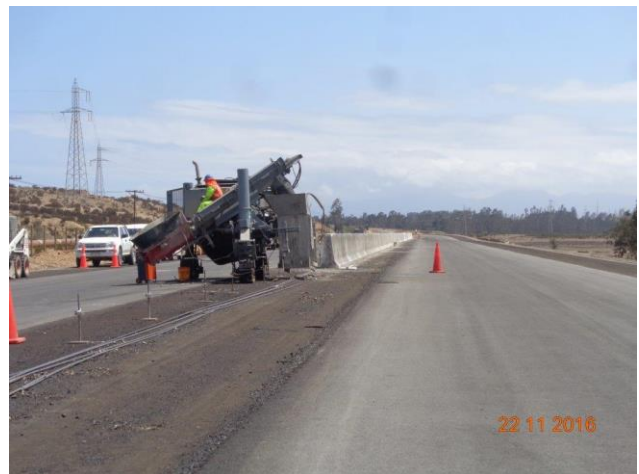
Imagen N°04 Trabajos Defensa de Hormigón mediana