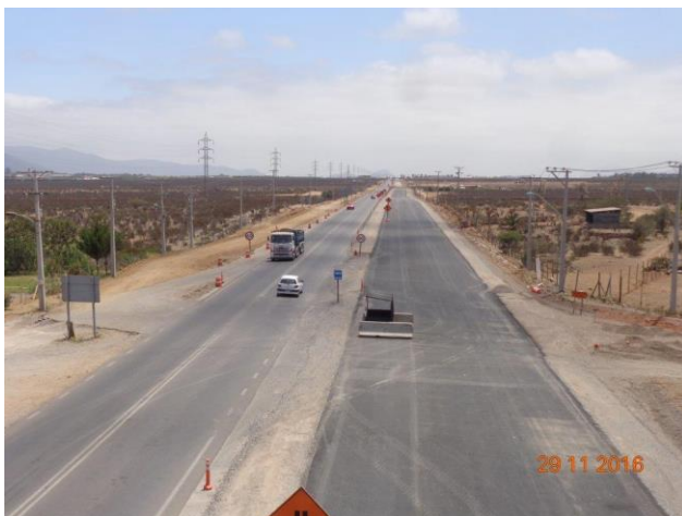
Imagen N°05. Vista Norte Enlace El Peñón