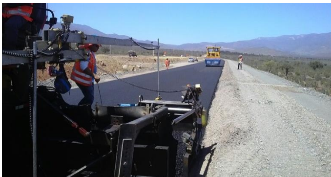
Trabajos Asfalto tramo 2

Tramo 4: Avenida Las Torres se ejecutará calzada simple entre Av. La Cantero y Av. Balmaceda.