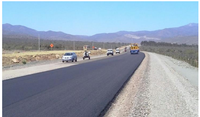
Imagen N°04 Trabajos Base Asfáltica Dm 45.900