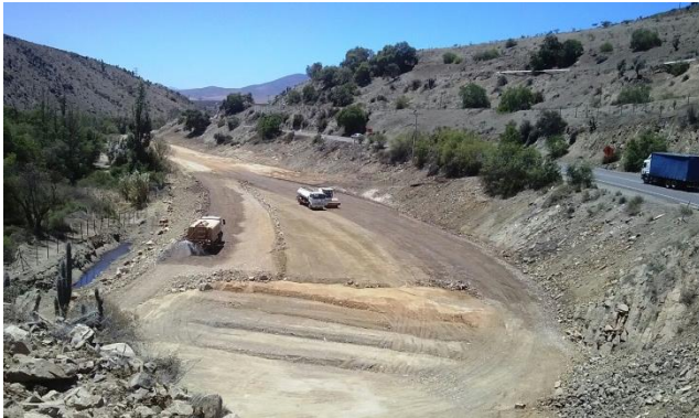
Imagen N°01. Trabajos Terraplén sector de Recoleta