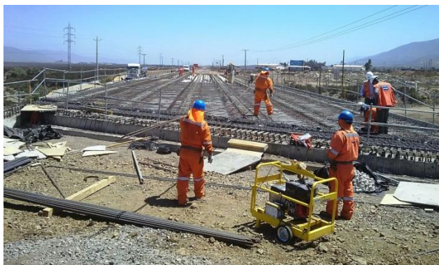
Imagen N°05. Enfierradura Losa Enlace El Peñón