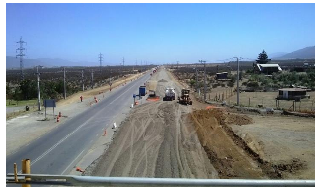
Imagen N°06. Trabajos Base Estabilizada Enlace El Peñón