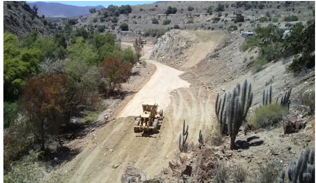
Imagen N°02. Trabajos Terraplén sector de Recoleta