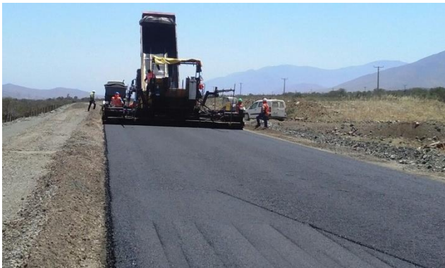
Imagen N°03 Trabajos Base Asfáltica Dm 45.900