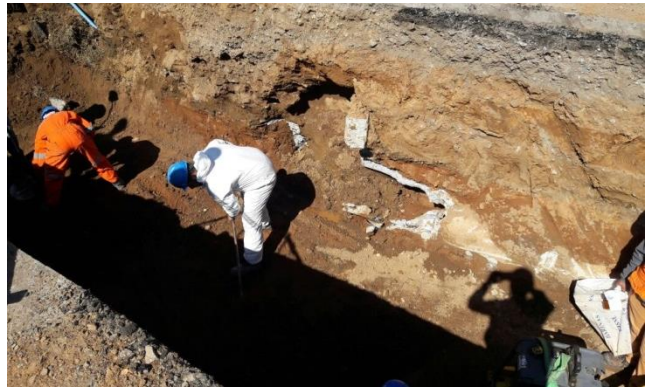
Imagen N°03 Trabajos OA tramo 3