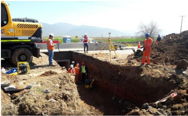
Imagen N°02 Trabajos OA tramo 3