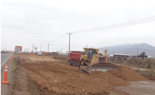
Imagen N°04. Movimiento de tierra tramo 1.4