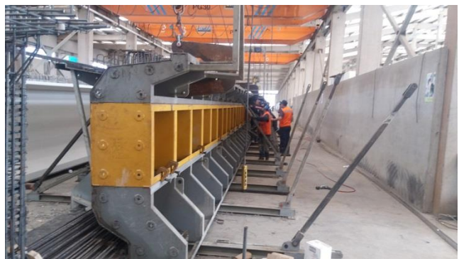
Imagen N°05. Moldajes vigas pretensadas