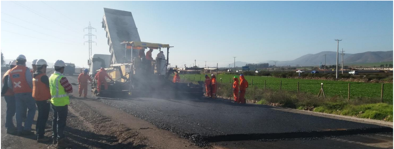
Imagen N°01. Inicio de los trabajos de pavimentación en tramo 2