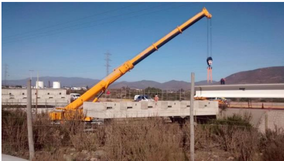
Instalación de Vigas Puente El Peñón Sur

Tramo 4: Avenida Las Torres se ejecutara calzada simple entre Av. La Cantero y Av. Balmaceda.