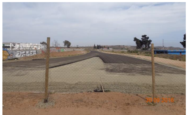
Imagen N°06. Trabajos Base asfáltica tramo 4