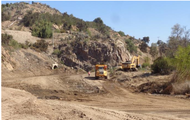
Imagen N°01. Trabajos Escarpe sector de Recoleta