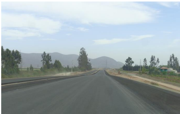
Imagen N°03 Trabajos Base Asfáltica tramo 2