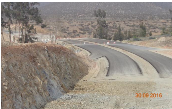
Imagen N°05. Trabajos Base asfáltica tramo 2.3