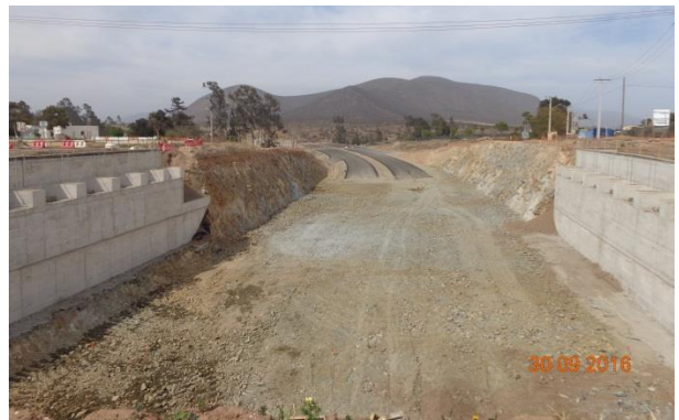
Imagen N°04 Trabajos pavimentación Enlace La cantera Sur