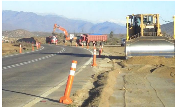
Imagen N°02. Trabajos de Terraplén Dm 23.500