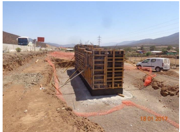
Imagen N°04 Moldaje Estribo Pasarela Las Cardas Sur