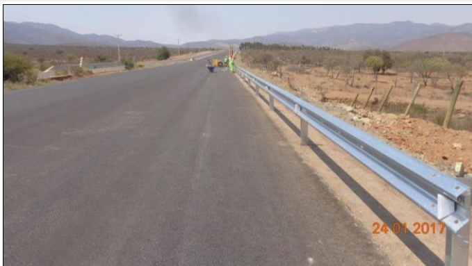
Colocación barreras metálicas Dm 45.375

Tramo 4: Avenida Las Torres se ejecutará calzada simple entre Av. La Cantero y Av. Balmaceda.