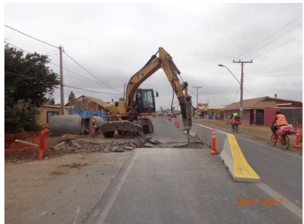
Imagen N°06. Construcción OA N° 21 Tramo 3.