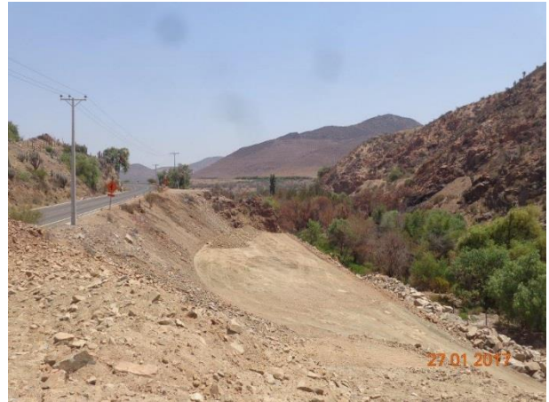
Imagen N°02. Formación de terraplenes Dm. 11.500