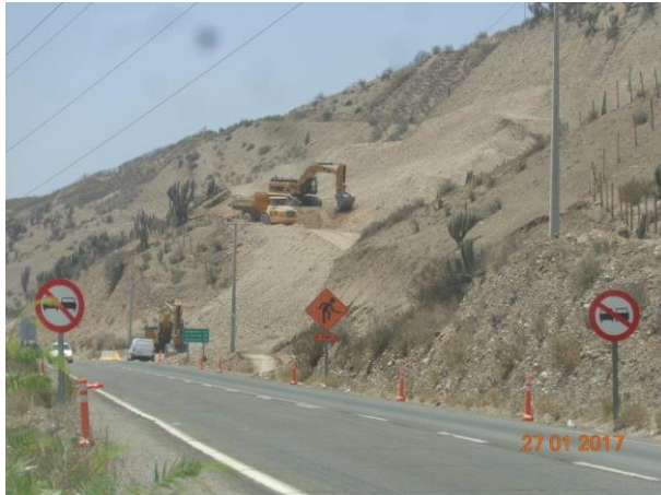
Imagen N°01. Excavación en corte Dm. 9.500