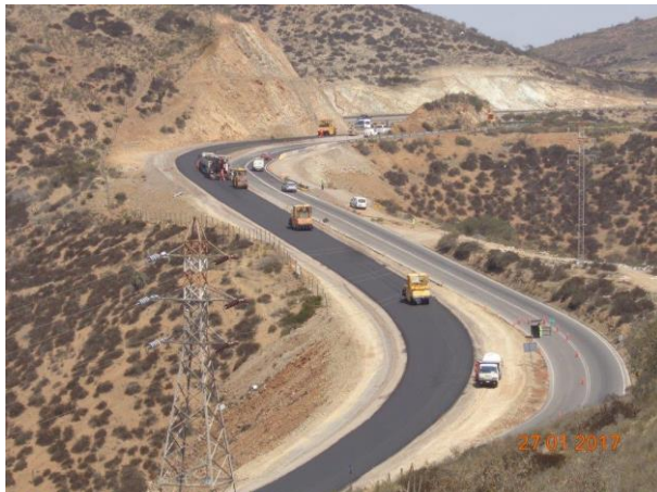
Imagen N°03 Colocación binder cuesta Las Cardas