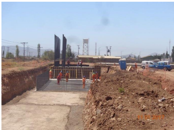
Imagen N°05. Fundación Estribo Oriente PS Ferrocarril