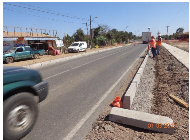
Imagen N°06. Colocación Soleras tipo A Tramo 3