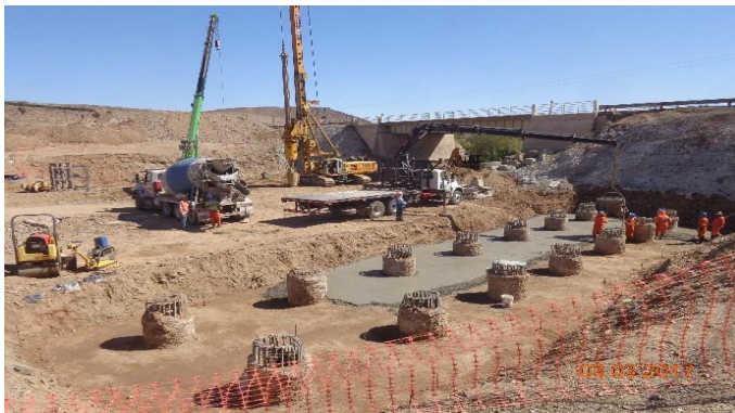
Pilotes estribo 01, Puente Recoleta.

Tramo 4: Avenida Las Torres se ejecutará calzada simple entre Av. La Cantero y Av. Balmaceda.