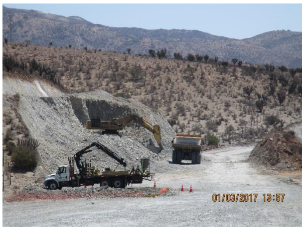
Imagen N°05. Excavación TCN Dm. 30.900