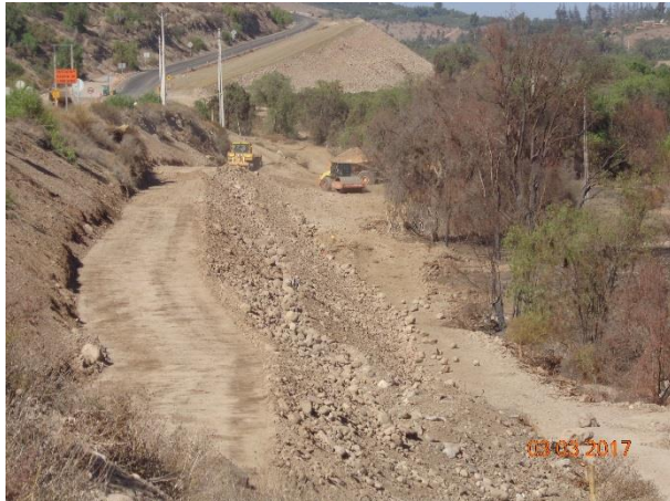
Imagen N°01. Formación terraplenes Dm. 9.500 Margen Izquierdo