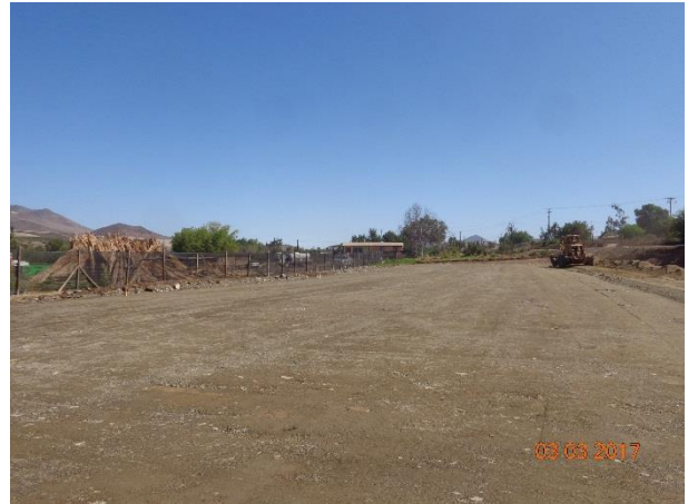
Imagen N°02. Formación terraplenes Dm. 12.000 Margen Izquierdo