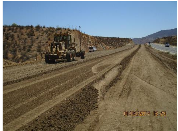
Imagen N°04. Base Granular Dm. 23.700