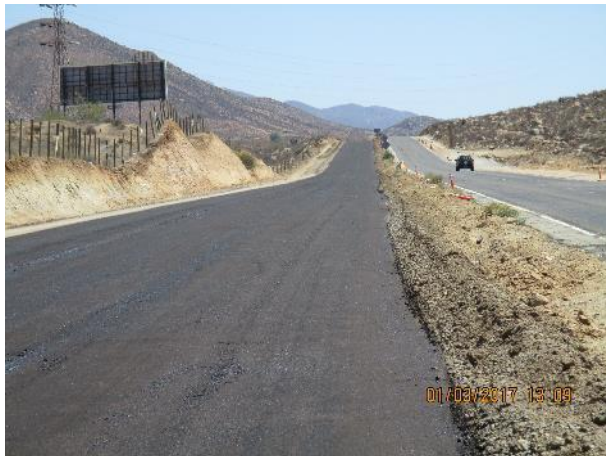
Imagen N°03. Imprimación Dm. 21.430 Margen Izquierdo