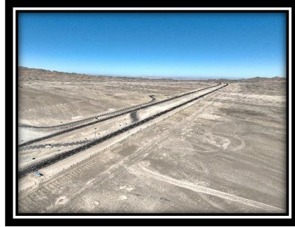
Cruce de Emergencia