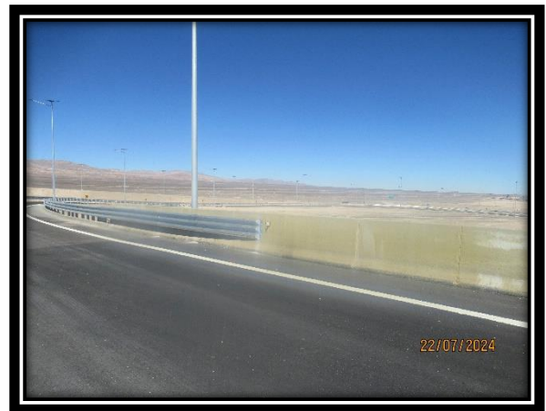
Transición de Barrera Metálica a Hormigón