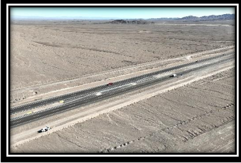
Cruce de Emergencia