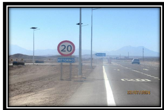
Elementos de Seguridad Vial