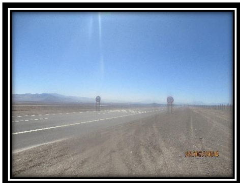
Elementos de Seguridad Vial