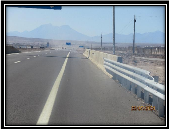
Transición de Barrera Metálica a Hormigón