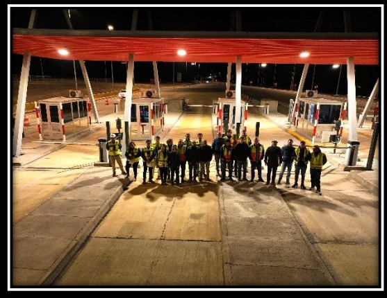
Puesta en marcha de PSP Provisoria.