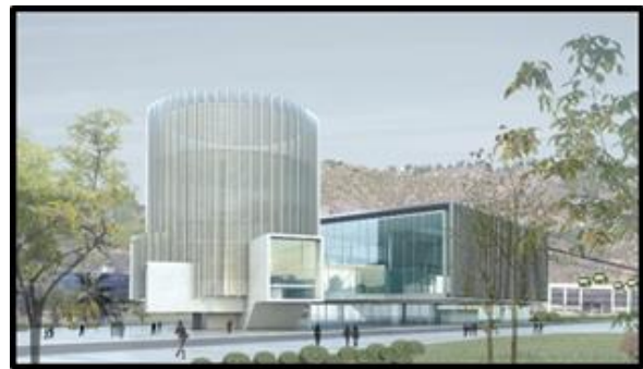
Estación Santa Clara (En Ciudad Empresarial – Huechuraba)