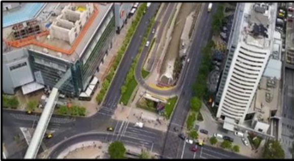
Vista zona Anteproyecto Estación Sobre canal San Carlos