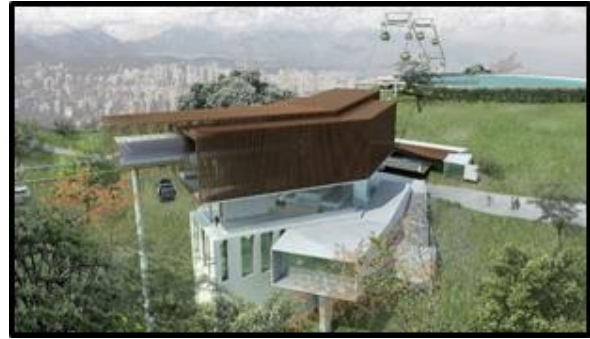
Estación Parque Metropolitano (Incluye equipamiento doble-motriz y nuevo acceso al Parque)