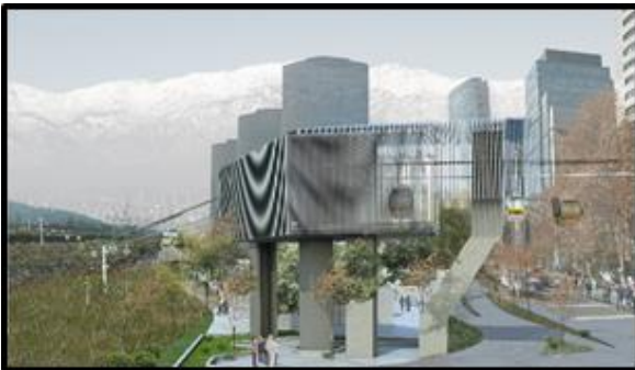
Punto de Quiebre (Av. Andrés Bello / Nueva Tajamar) (Solo redirecciona trazado)