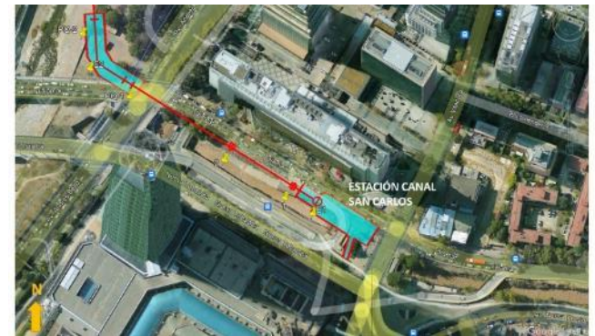
Ubicación Estación Canal San Carlos