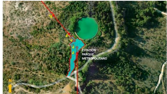
Ubicación Estación Parque Metropolitano