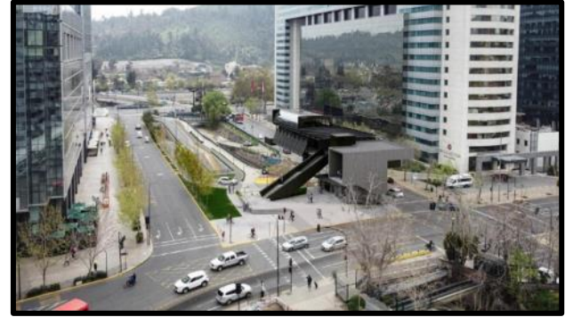
Estación Canal San Carlos