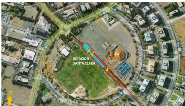
Ubicación Estación Santa Clara