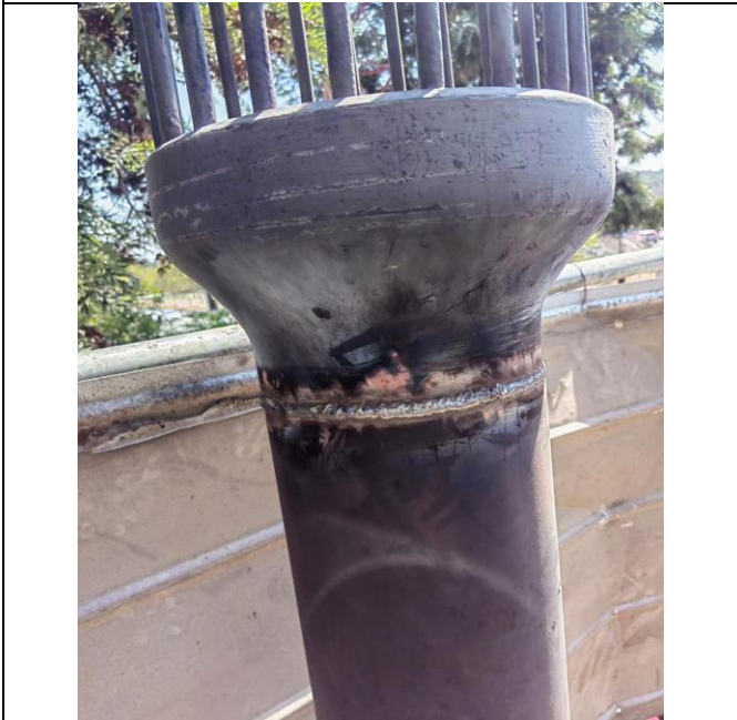
Corte y soldadura de Chimenea Punto de Quiebre