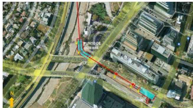
Ubicación Punto de Quiebre