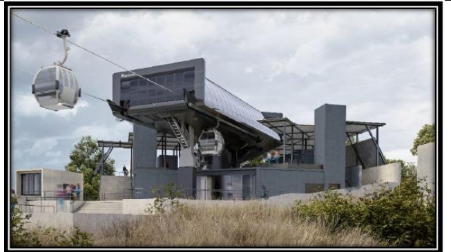
Estación Parque Metropolitano