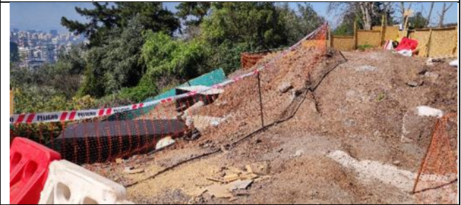
Sector Pila 9