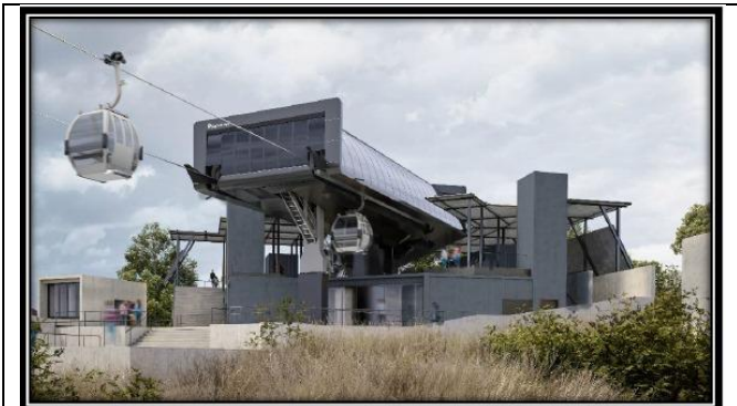
Estación Parque Metropolitano