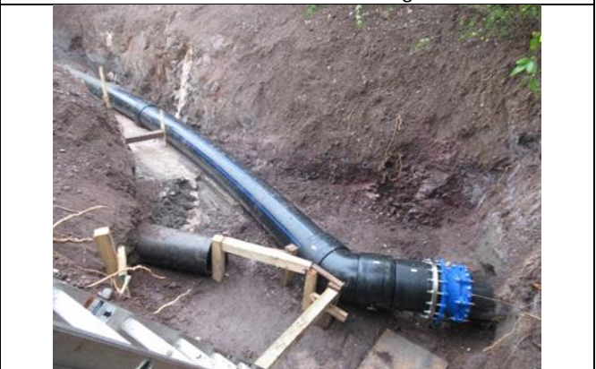
Obras de Regadío