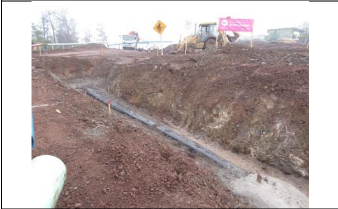
Tubería para Regadío