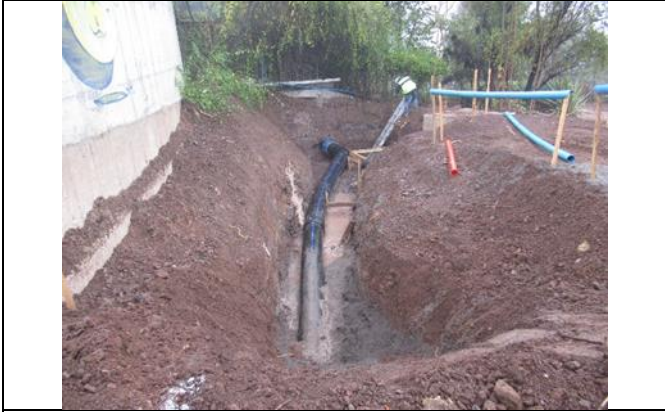
Tubería para Regadío