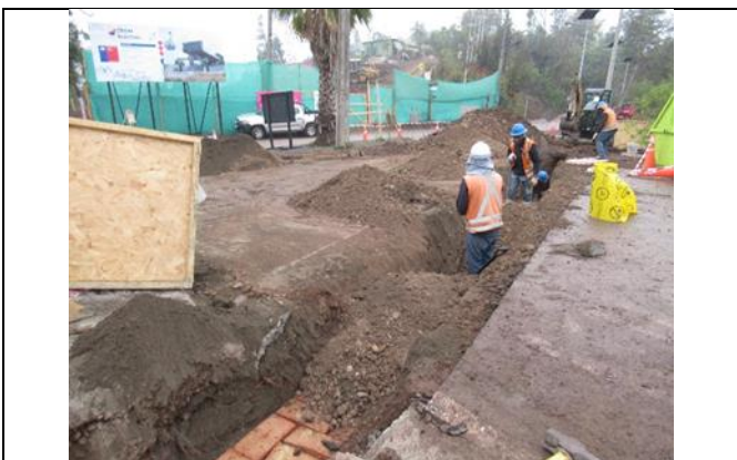
Obras Civiles Media Tensión