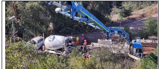
Hormigonado de fundación torre AT