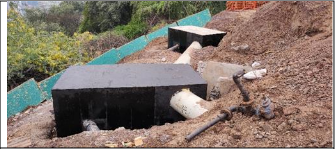
Impermeabilización de machones sector Pila 9