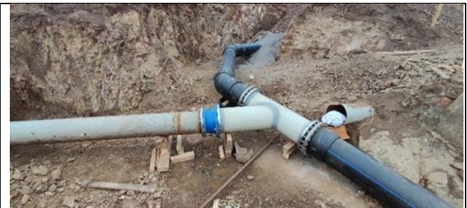
Nudo de conexión Tubería de riego PMet