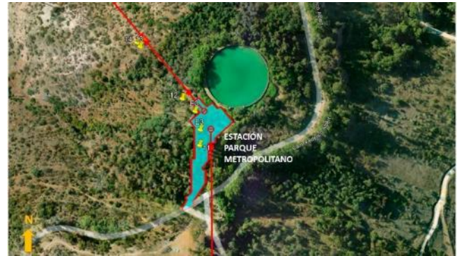
Ubicación Estación Parque Metropolitano