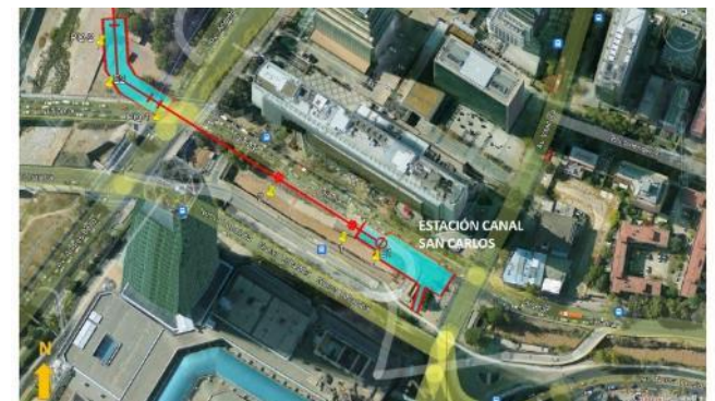
Ubicación Estación Canal San Carlos