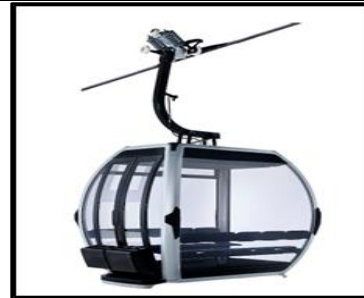
Cabina 10 pasajeros