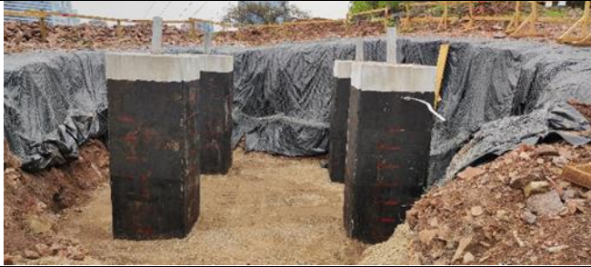
Fundaciones torre AT