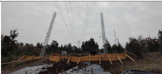
Vista de torres AT auxiliares