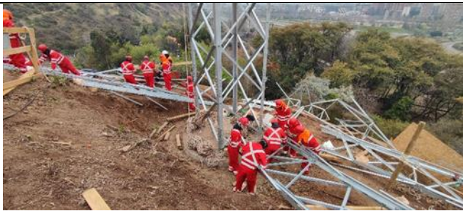
Armado de torre AT