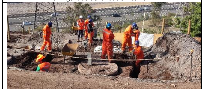
Excavación para malla de tierra torre AT