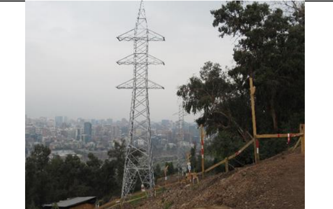
Torres AT N°5 y 6 terminadas