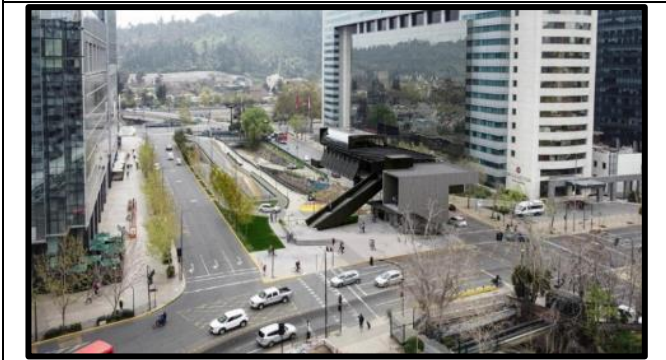
Estación Canal San Carlos