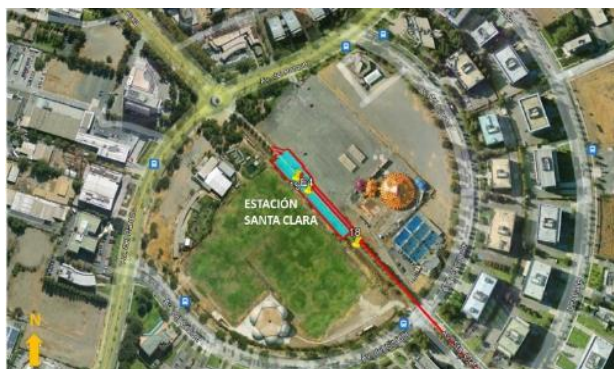
Ubicación Estación Santa Clara