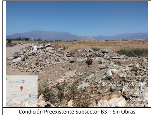
Condición Preexistente Subsector B3 – Sin Obras