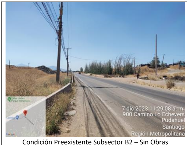
Condición Preexistente Subsector B2 – Sin Obras