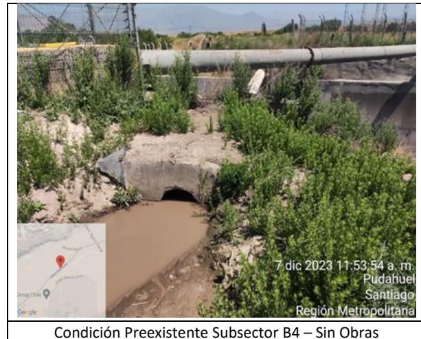
Condición Preexistente Subsector B4 – Sin Obras