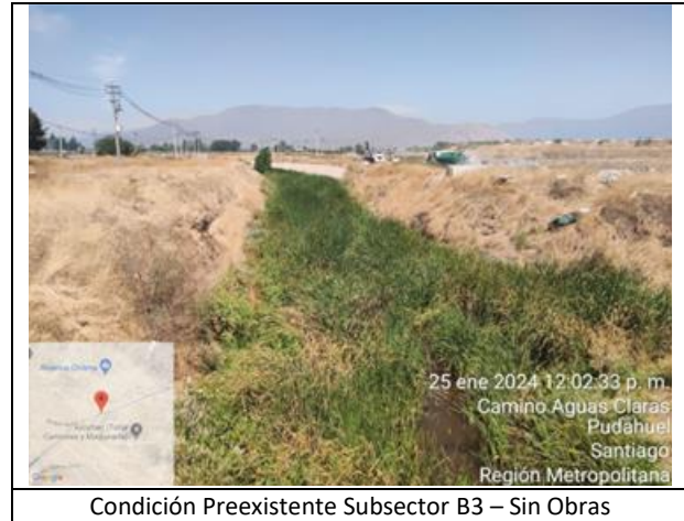
Condición Preexistente Subsector B3 – Sin Obras