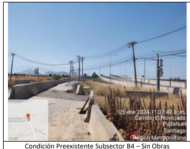
Condición Preexistente Subsector B4 – Sin Obras