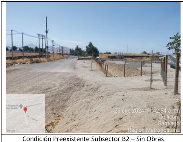
Condición Preexistente Subsector B2 – Sin Obras