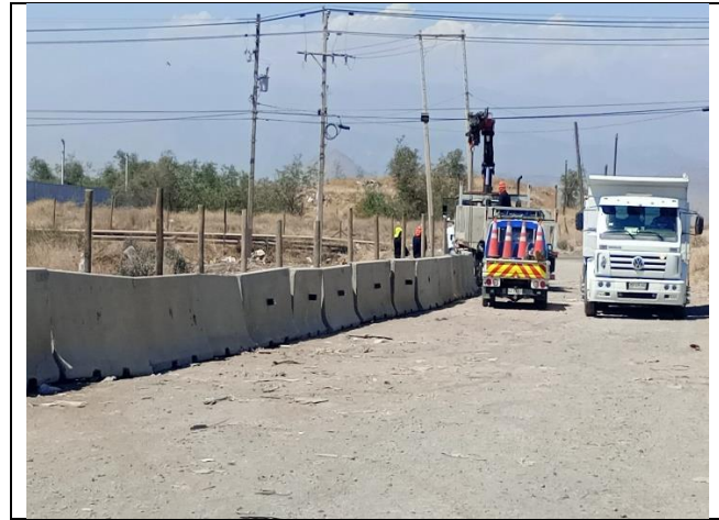
Condición Preexistente Subsector B3 – Sin Obras