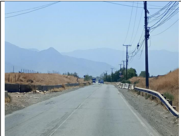
Condición Preexistente Subsector B2 – Sin Obras