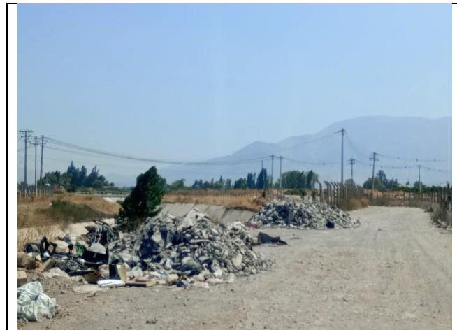
Condición Preexistente Subsector B4 – Sin Obras