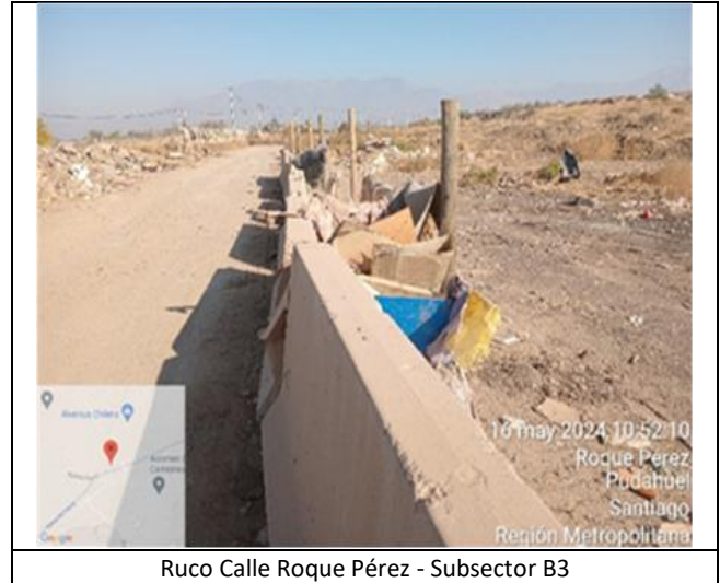
Ruco Calle Roque Pérez - Subsector B3