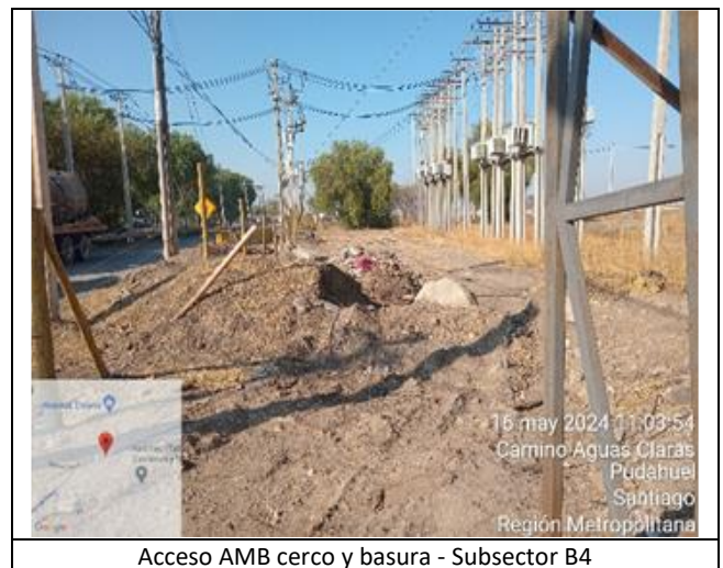
Acceso AMB cerco y basura - Subsector B4