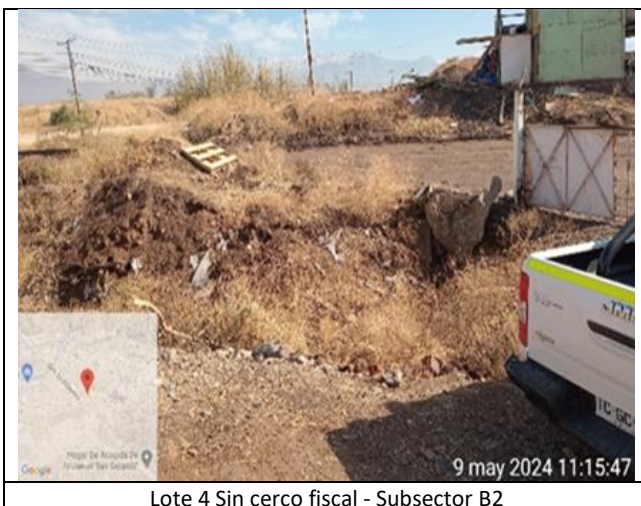
Lote 4 Sin cerco fiscal - Subsector B2