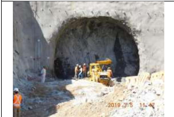
VISTA TÚNEL NUEVO ACCESO NORTE