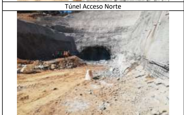
Túnel Acceso Norte