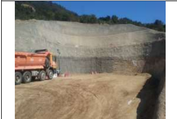
VISTA PANORAMICA PORTAL SUR