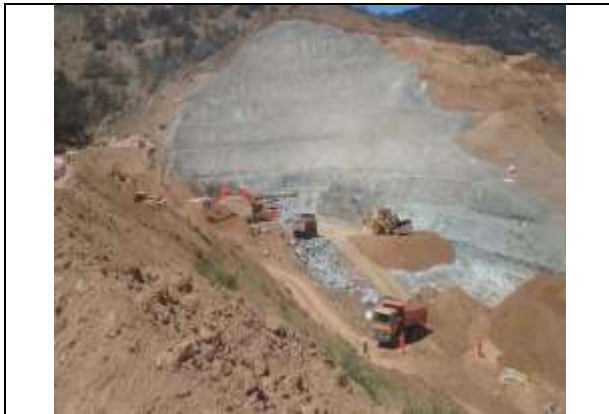
VISTA PANORAMICA PORTAL NORTE