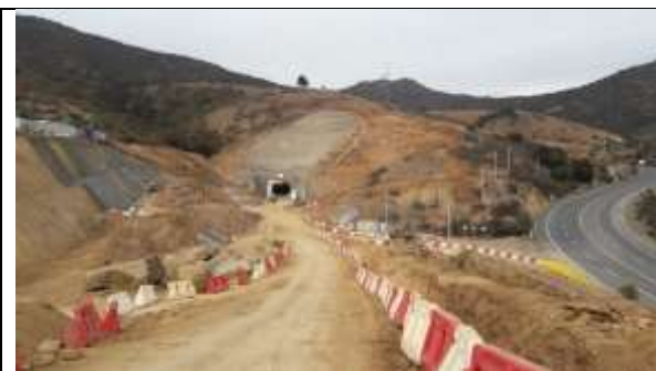
Vista panorámica Portal Norte