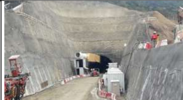
Acceso Túnel Sur