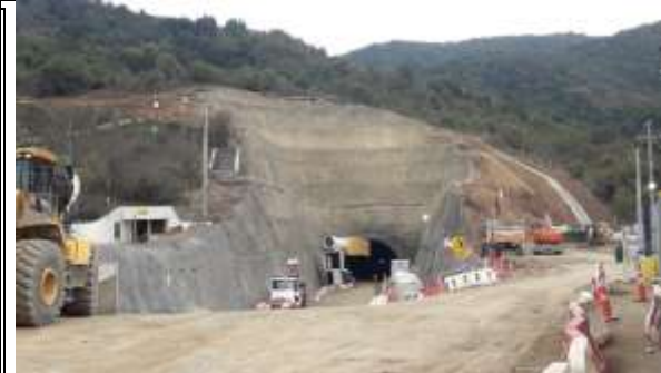
Vista panorámica Portal Sur