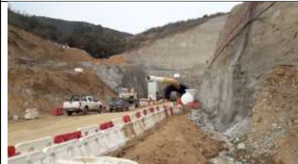
Acceso Túnel Norte