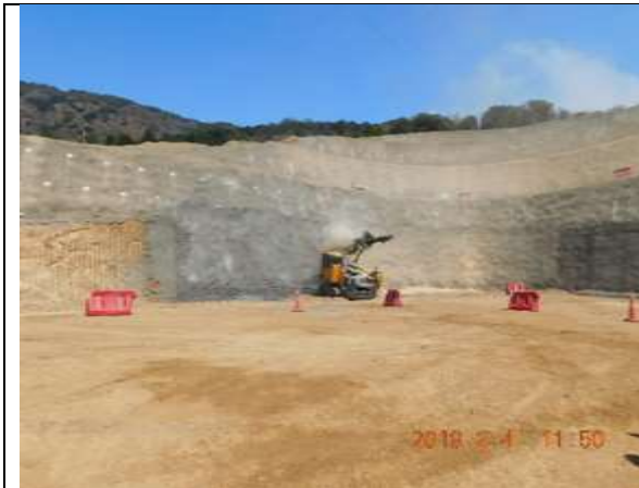
Vista panorámica Portal Sur