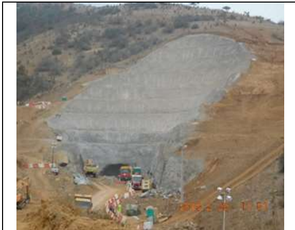
Vista panorámica Portal Norte