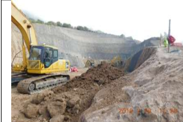
Excavación Talud poniente Portal Sur