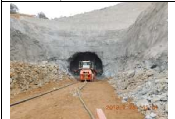
Vista frontal nuevo Túnel Acceso Norte