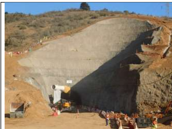
Vista panorámica Portal Norte