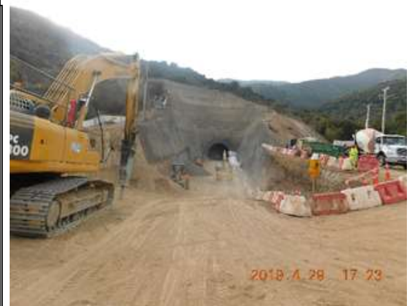
Vista panorámica Portal Sur