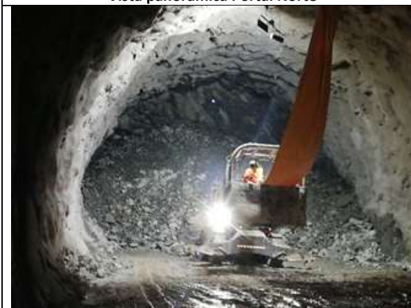
Vista interior del Túnel Norte