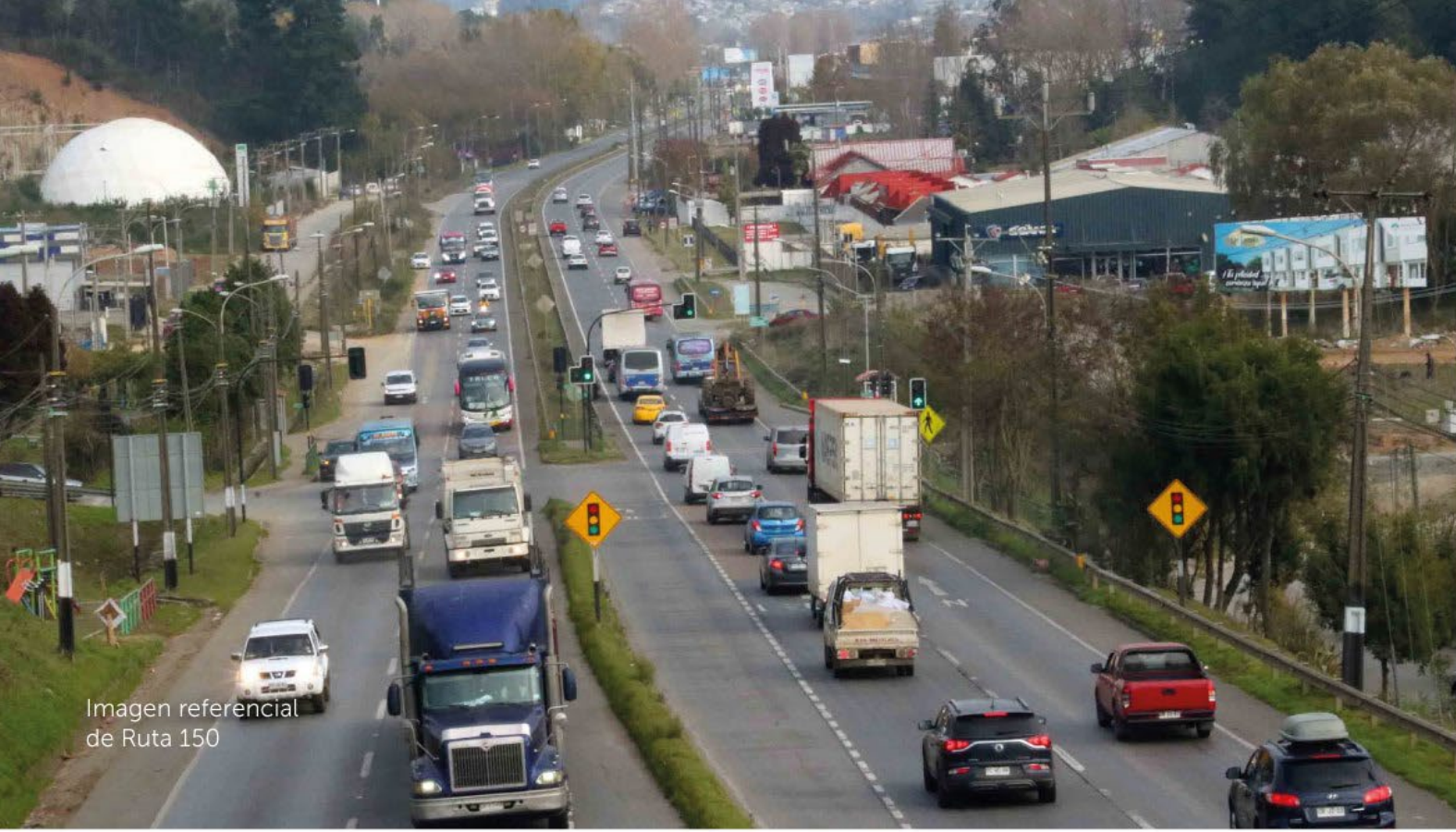
Imagen referencial de Ruta 150