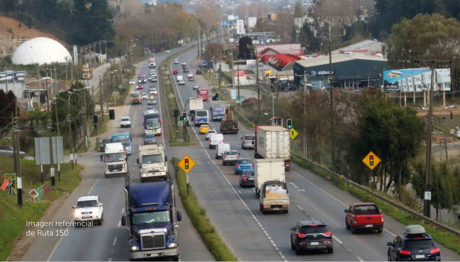
Imagen referencial de Ruta 150