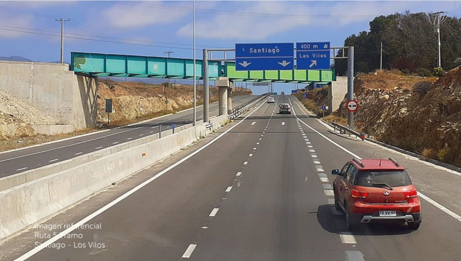
Imagen referencial Ruta 5 Tramo Santiago - Los Vilos