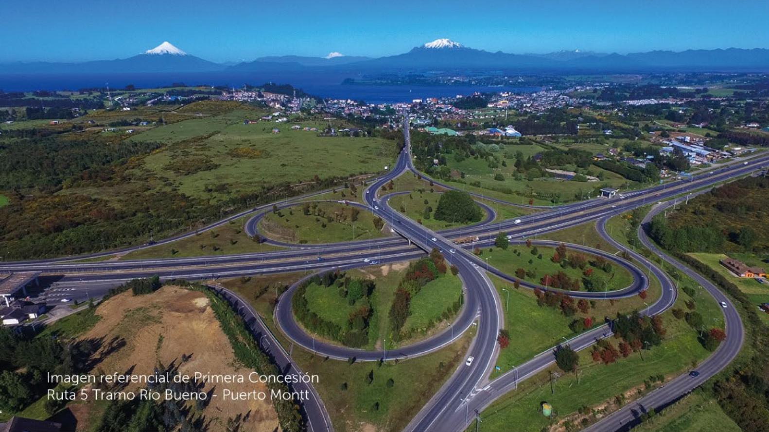
Imagen referencial de Primera Concesión Ruta 5 Tramo Río Bueno - Puerto Montt