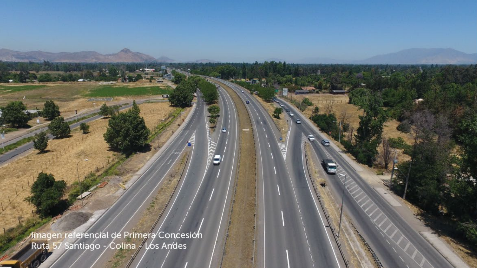
Imagen referencial de Primera Concesión Ruta 57 Santiago - Colina - Los Andes