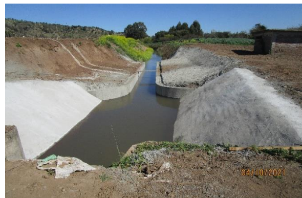
Canal La Fuente, Inspección de obras de Compensación Res. 2056

En 2021, solo hay aprobación para Obras del sector de Nerquihue Bajo y La Cabaña.