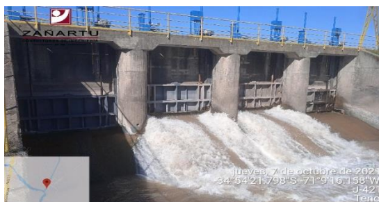
Bocatoma canal Tenó-Chimbarongo.

Se miden los caudales de entrada al embalse, y se revisa el balance hidrológico que elabora diariamente la Sociedad Concesionaria, cuantificando los volúmenes de almacenamiento del embalse y verificando que se disponga para la temporada de riego de los volúmenes de agua que permitan cumplir con los contratos que suscribe la Sociedad Concesionaria con los regantes del Valle de Chimbarongo y otros clientes.