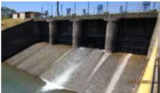
Bocatoma canal Teno-Chimbarongo.

Se miden los caudales de entrada al embalse, y se revisa el balance hidrológico que elabora diariamente la Sociedad Concesionaria, cuantificando los volúmenes de almacenamiento del embalse y verificando que se disponga para la temporada de riego de los volúmenes de agua que permitan cumplir con los contratos que suscribe la Sociedad Concesionaria con los regantes.