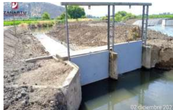
Bocatoma Patagua-Patagüilla, Inspección de obras de Compensación Res. 2056

En 2021, solo hay aprobación para Obras del sector de Nerquihue Bajo y La Cabaña.