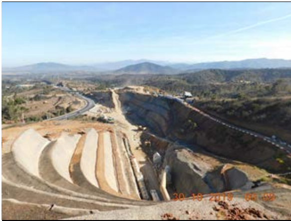
Vista panorámica Portal Norte