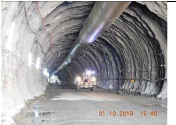
Vista interior Túnel Sur