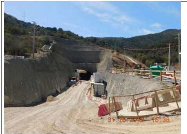
Vista panorámica Portal Sur