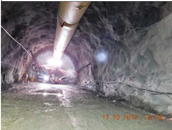
Perforación para instalación barbacanas en Túnel Norte