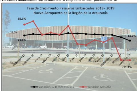
Gráfico 1: Tasa de Crecimiento últimos 12 meses

(****) Corresponde a variación acumulada noviembre 2019 respecto similar periodo 2018.