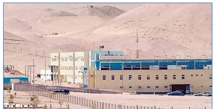
Establecimiento Penitenciario de Alto Hospicio