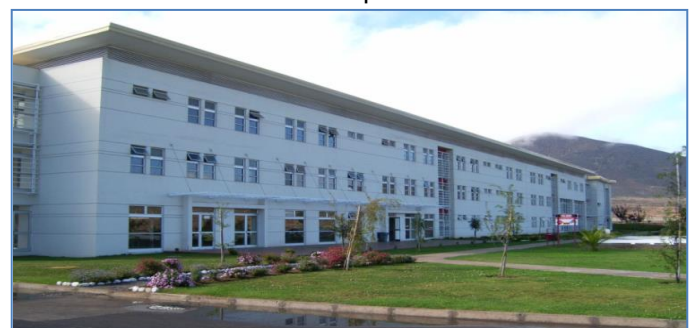
Establecimiento Penitenciario de La Serena