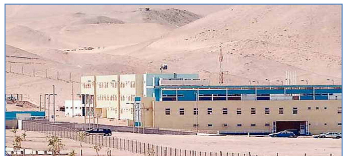
Establecimiento Penitenciario de Alto Hospicio