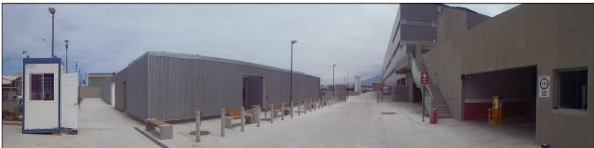
Jardín Infantil (izquierda), edificio UPC (derecha)