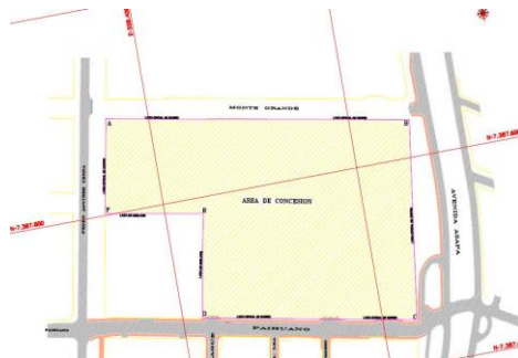
Emplazamiento Área de Concesión