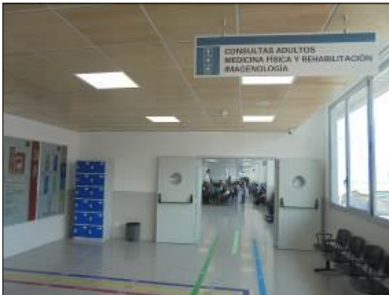
Consultas Adultos, Medicina Física