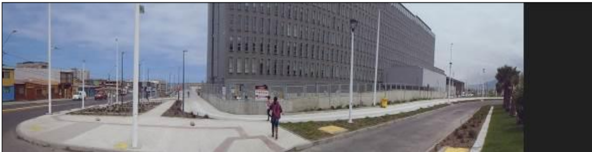
Edificio Torre de Hospitalización – TH – esquina calles Azapa/Víctor Jara