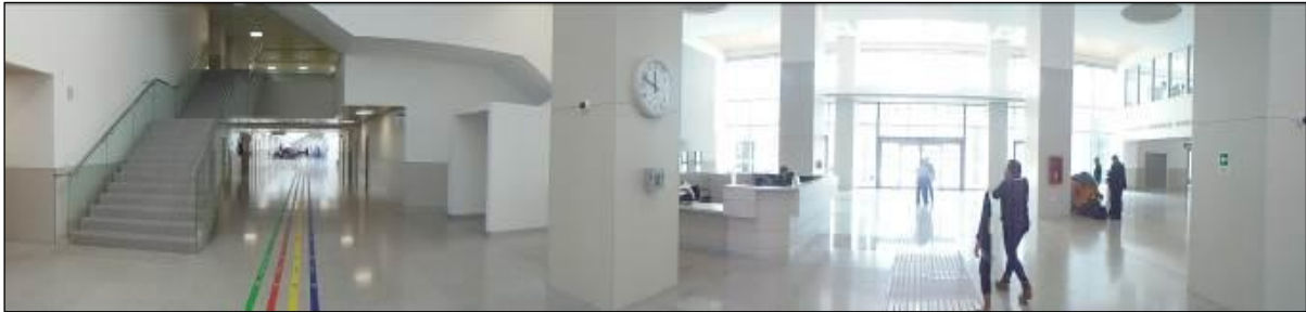
Puerta acceso y senderos de colores indicativos hacia Consultas Externas