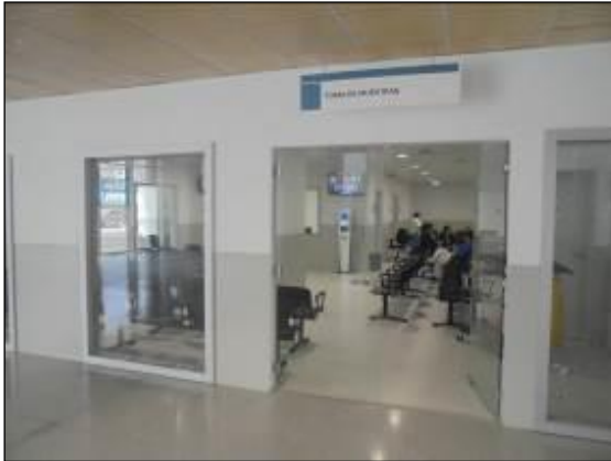
Toma de Muestras