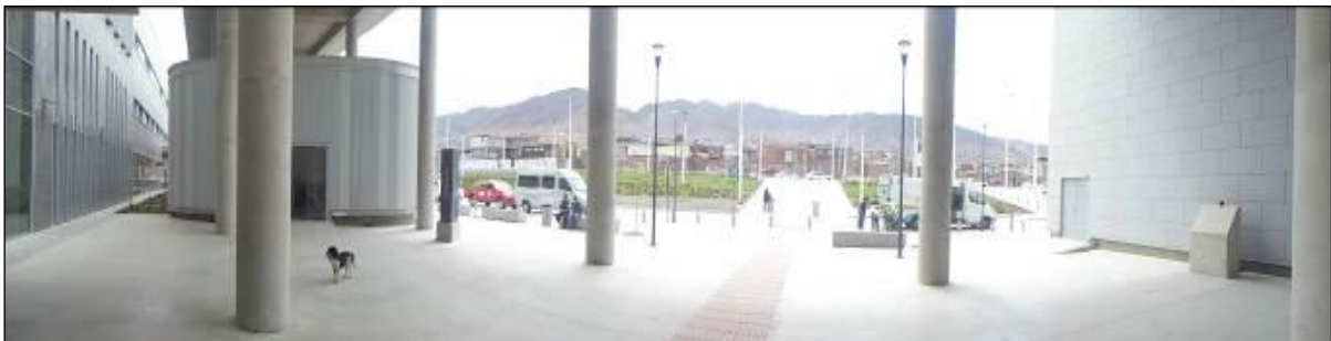
Hall de acceso, Entrada a Cafetería (izquierda), Salida Exterior del Auditorio (derecha)