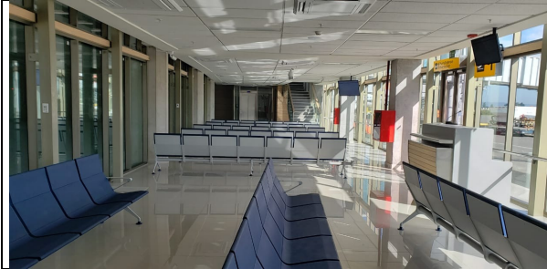
Otra vista sala de embarque remoto