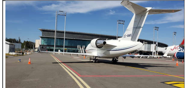
Utilización de puesto remoto