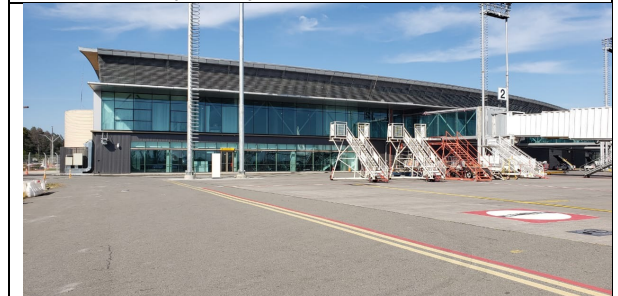
Vista de ampliación de sala de embarque y oficinas SC e IF