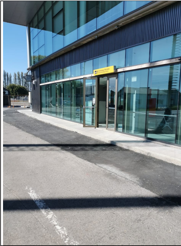
Acceso a sala de embarque remota