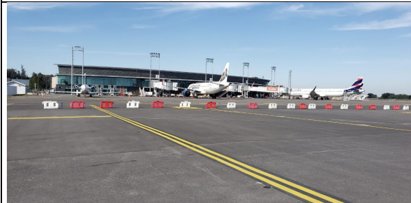
Vista frontal del aeropuerto