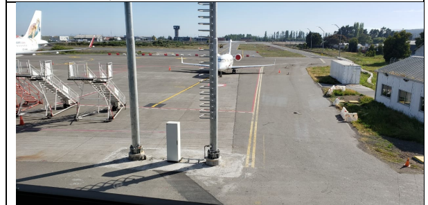
Otra vista del puesto remoto