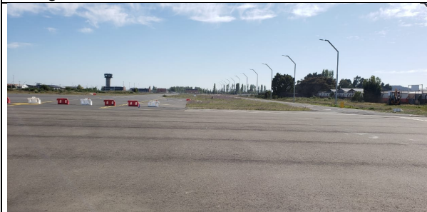
Plataforma Quebec y calles de rodaje Hotel e India