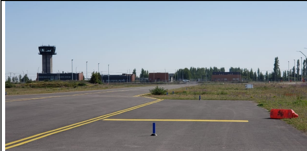
Vista general de las instalaciones DGAC