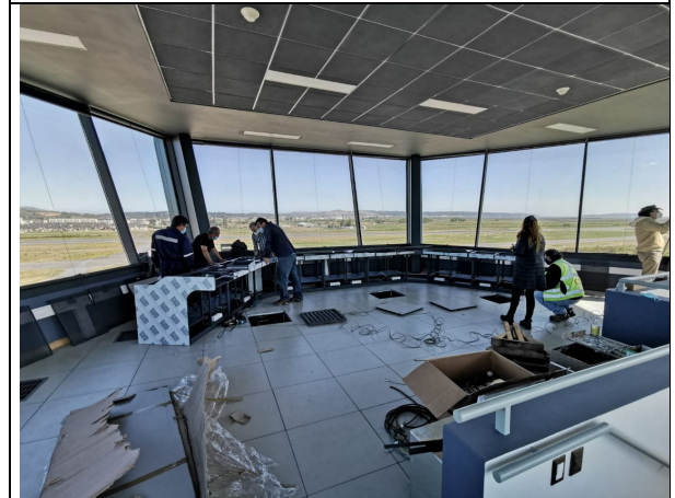
Cabina Torre de Control – equipamiento DGAC