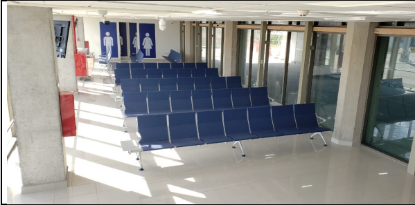
Sala de embarque remoto