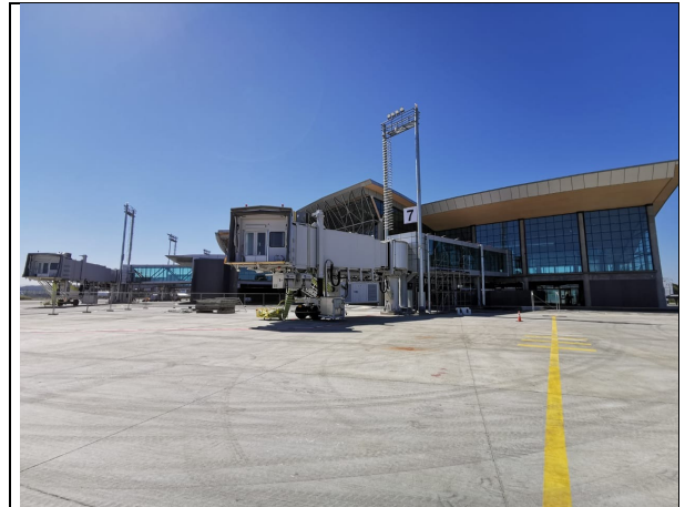
Vista del nuevo puente y área internacional