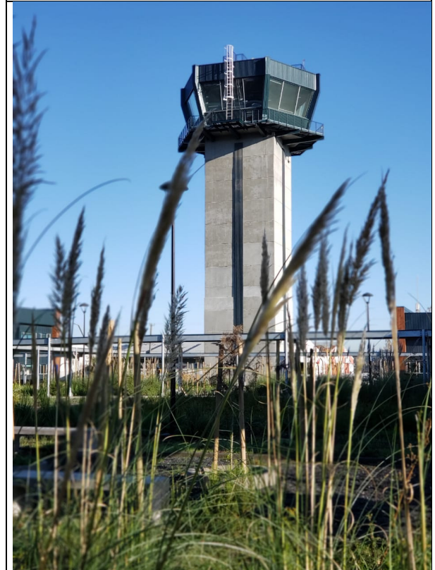
Torre de control