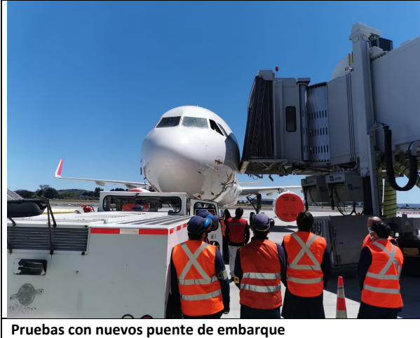
Pruebas con nuevos puente de embarque