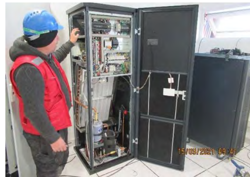
Edificio ARO-SAM-CMRS: INSTALACIÓN EQ. CLIMA DE PRECISIÓN