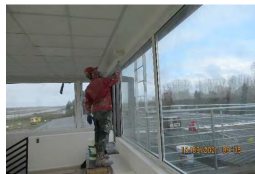
CUARTEL SSEI DEF.: PINTADO DE CENEFAS EN CABINA OBSERVACIÓN