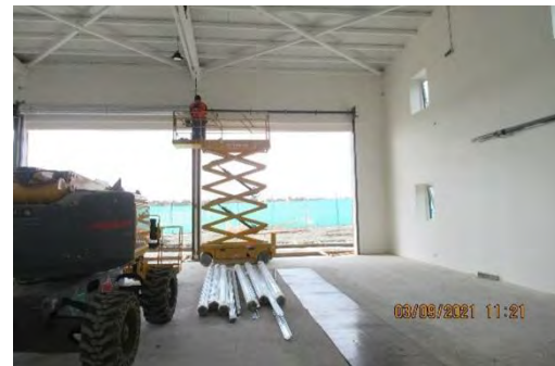
CUARTEL SSEI DEF.: MONTAJE CORTINAS METALICAS ENROLLABLES