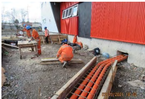
ELECTRICIDAD: INCORPORACIÓN BANCO DE DUCTOS ADICIONALES (SB)