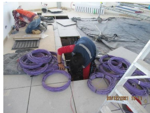
Edif. TORRE DE CONTROL: CABLEADO UTP BAJO PISO TÉCNICO EN CABINA