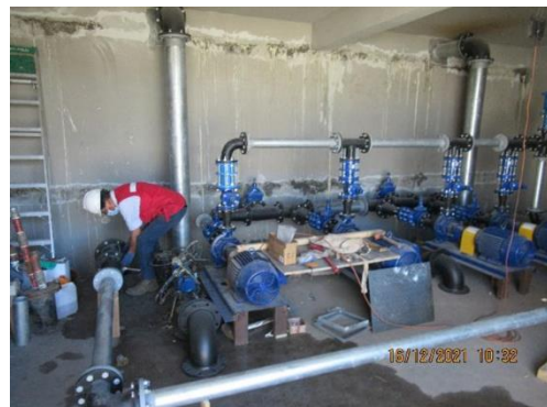
AGUA POTABLE: MONTAJE BOMBAS EN ESTANQUE A.POTABLE