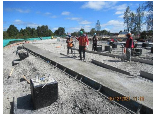
MOLDAJES PARA PAVIMENTACIÓN EN VIALIDAD ACCESO FACH