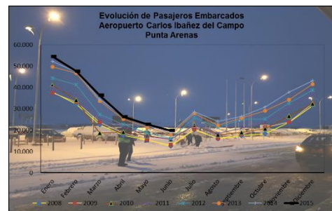
Gráfico 2: Pasajeros Embarcados de 2008 a 2015