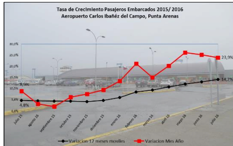
Gráfico 1: Tasa de Crecimiento últimos 12 meses

* Corresponde a la variación acumulada a julio 2016 respecto similar período 2015.