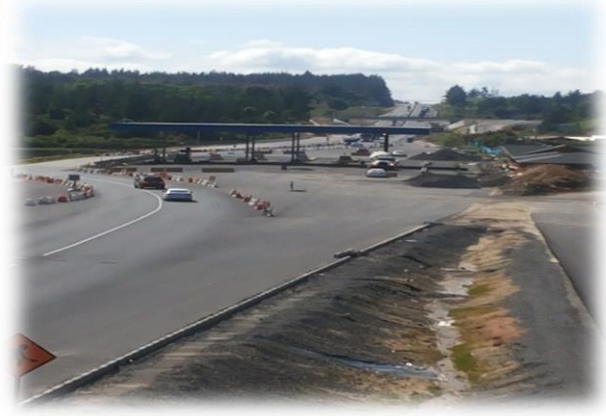
Demolición Puente San Antonio Sur, Dm. 55.500, Sector A