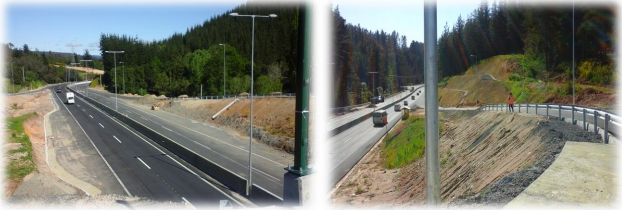
Vista desde Enlace Los Arias, Dm. 49.540, Sector A