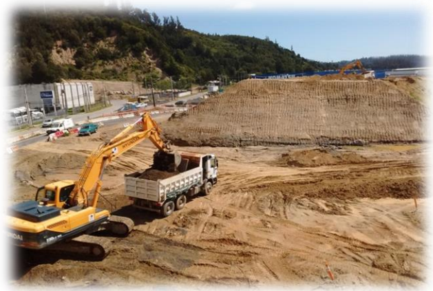
Excavación Terraplén de Precarga Paso Superior Palomares I, Dm. 70.000, Sector A

En sector Paso Superior Palomares I, finalizada la precarga, se continúa con obras de movimiento de tierra, preparando la zona para materializar la estructura y los muros TEM. En el Paso Inferior Retorno Collao (Dm 71.400), se mantiene habilitado a tránsito.