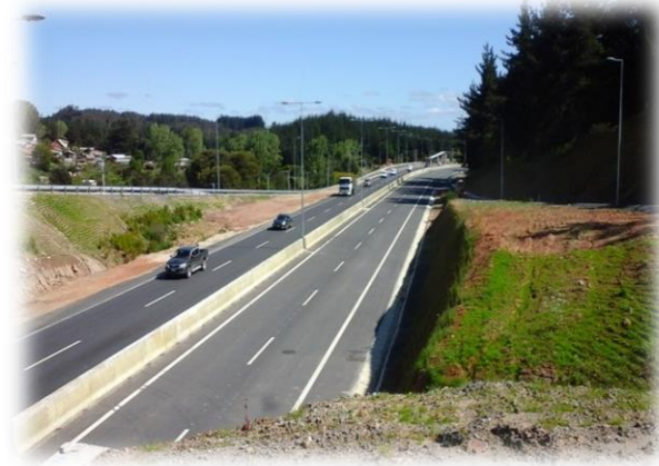
Vista Enlace Copiulemu, Dm. 44.350, Sector A