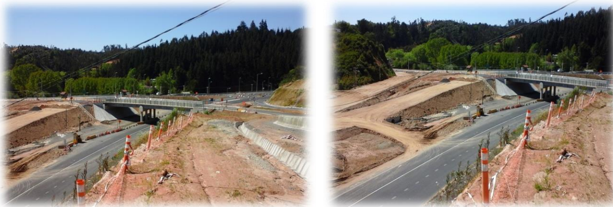
Vista Enlace Agua de la Gloria, Dm. 60.000, Sector A