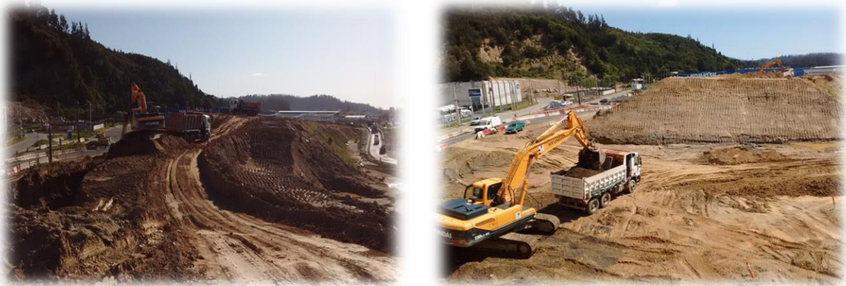
Excavación Terraplén de Precarga Paso Superior Palomares I, Dm. 70.000, Sector A