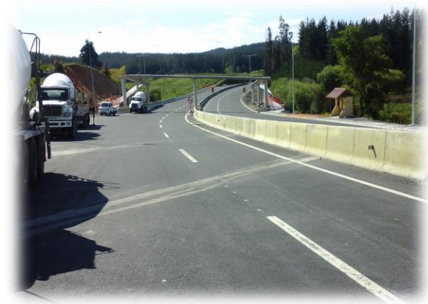
Pasarela Peatonal Quebrada Las Ulloas, Dm. 46.900, Sector A