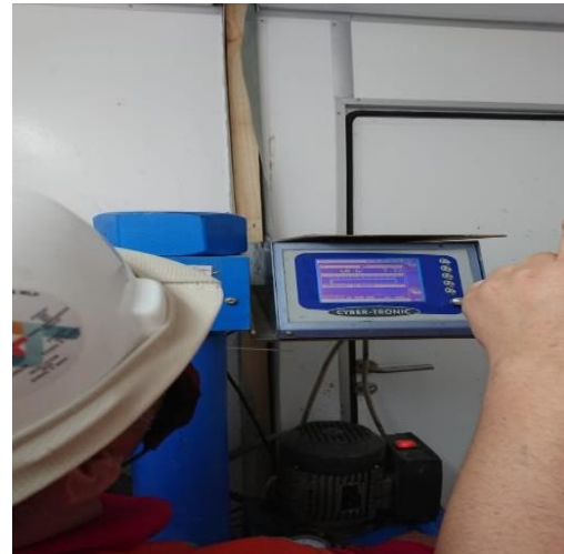
Medicion de Resistencia a 24 horas de Testigos de Shotcrete