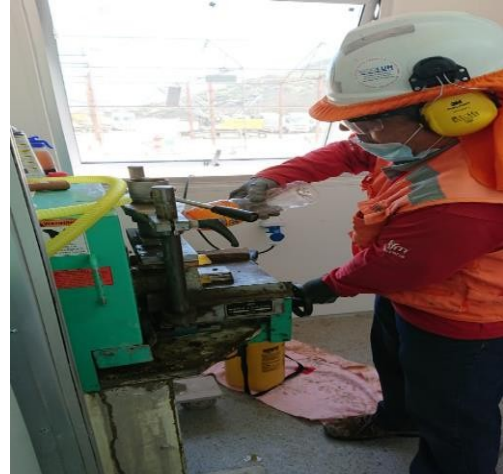
Acerrado de Testigos de Shotcrete en Laboratorio de Autocontrol