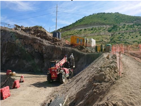
Portal de entrada Proyeccion de Shotcrete