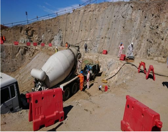
Portal de entrada, Faenas de Shotcrete