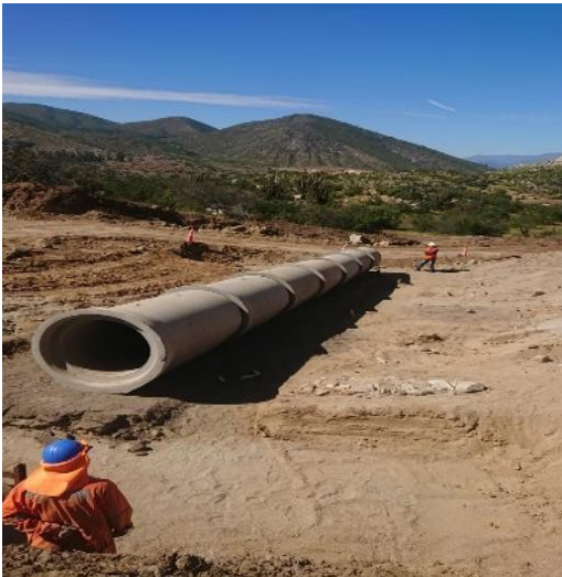
Ruta E-377 colocacion de Tubos en OA-2