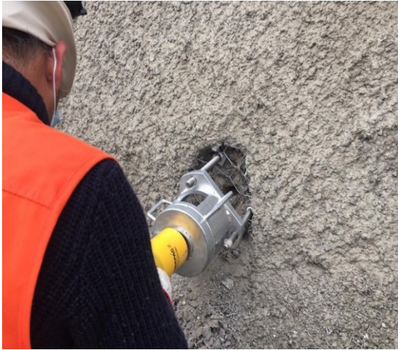
Toma de Muestras de Hormigon Laboratorio de Autocontrol