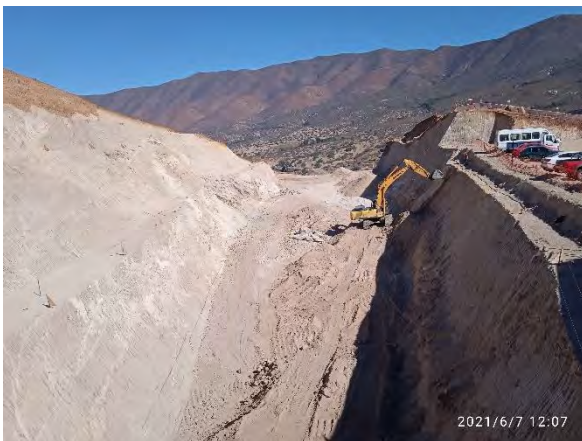
Muro Plinto izquierdo