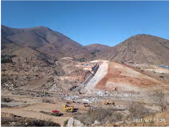
Muro principal, plinto derecho, izquierdo, valle a nivel de excavación