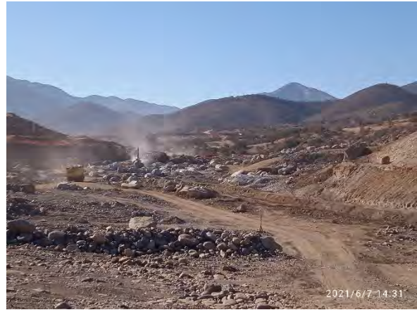
Muro Principal – Valle