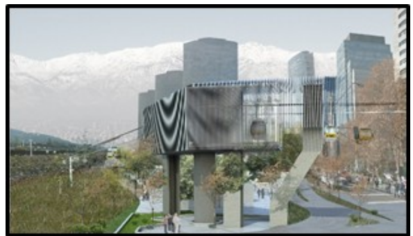
Punto de Quiebre (Av. Andrés Bello / Nueva Tajamar) (Solo redirecciona trazado)