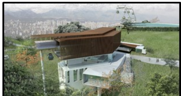
Estación Parque Metropolitano (Incluye equipamiento doble-motriz y nuevo acceso al Parque)