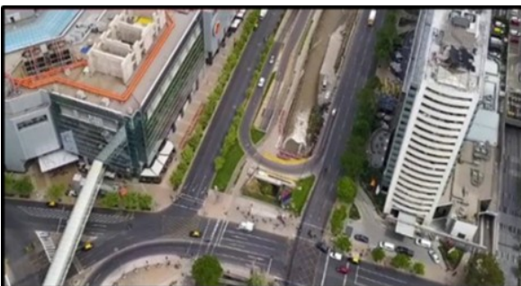
Vista zona Anteproyecto Estación Sobre canal San Carlos