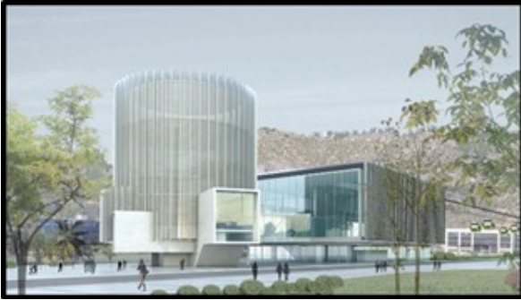
Estación Santa Clara (En Ciudad Empresarial – Huechuraba)