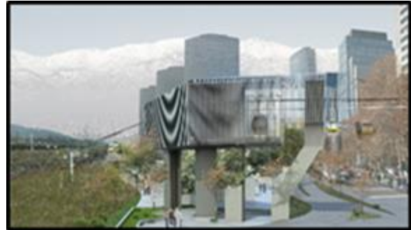
Punto de Quiebre (Av. Andrés Bello / Nueva Tajamar - Solo redirecciona trazado)

No se han iniciado, por lo que la curva S aún no aplica. Depende de aprobación del PID por el Inspector Fiscal y de la entrega de los terrenos para ejecutar las obras. Se estima preliminar y optimistamente que se podría iniciar la construcción el primer trimestre de 2023, dependiendo del estatus de aprobaciones del PID en cada sector del proyecto y de la entrega de terrenos.