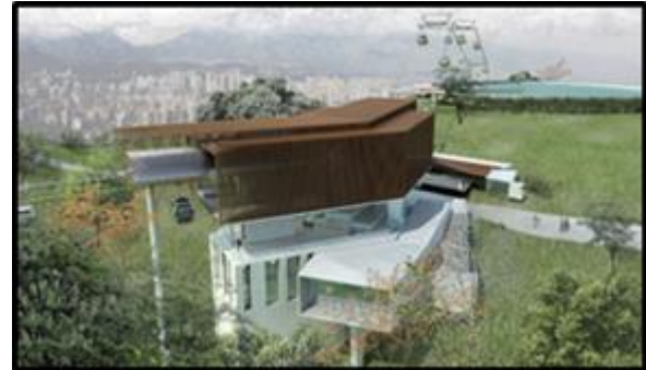
Estación Parque Metropolitano (Incluye equipamiento doble-motriz y nuevo acceso al Parque)