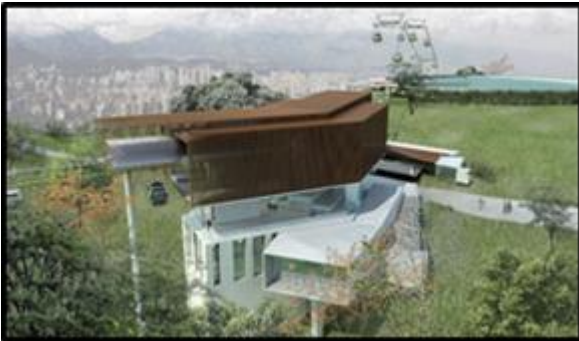
Estación Parque Metropolitano (Incluye equipamiento doble-motriz y nuevo acceso al Parque)