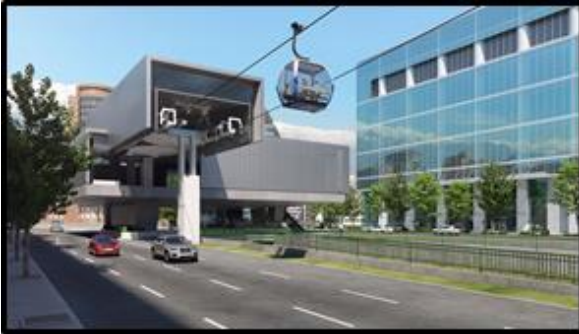
Estación sobre canal San Carlos