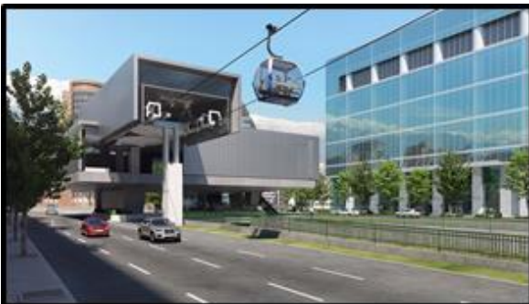
Estación sobre canal San Carlos