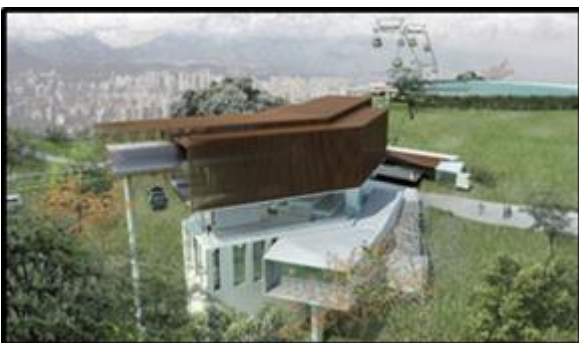
Estación Parque Metropolitano (Incluye equipamiento doble-motriz y nuevo acceso al Parque)